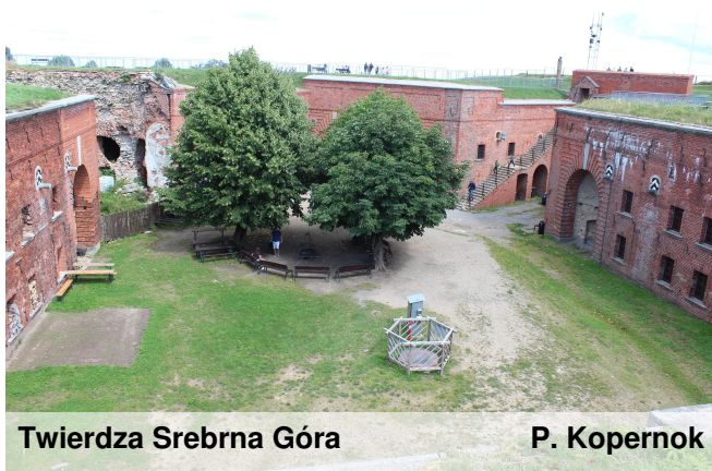
Twierdza Srebrna Góra P. Kopernok