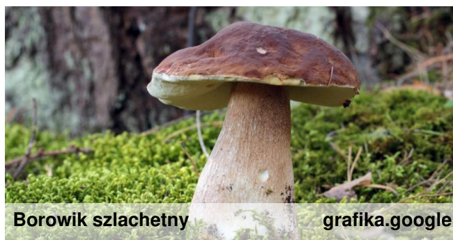
Borowik szlachetny grafika.google