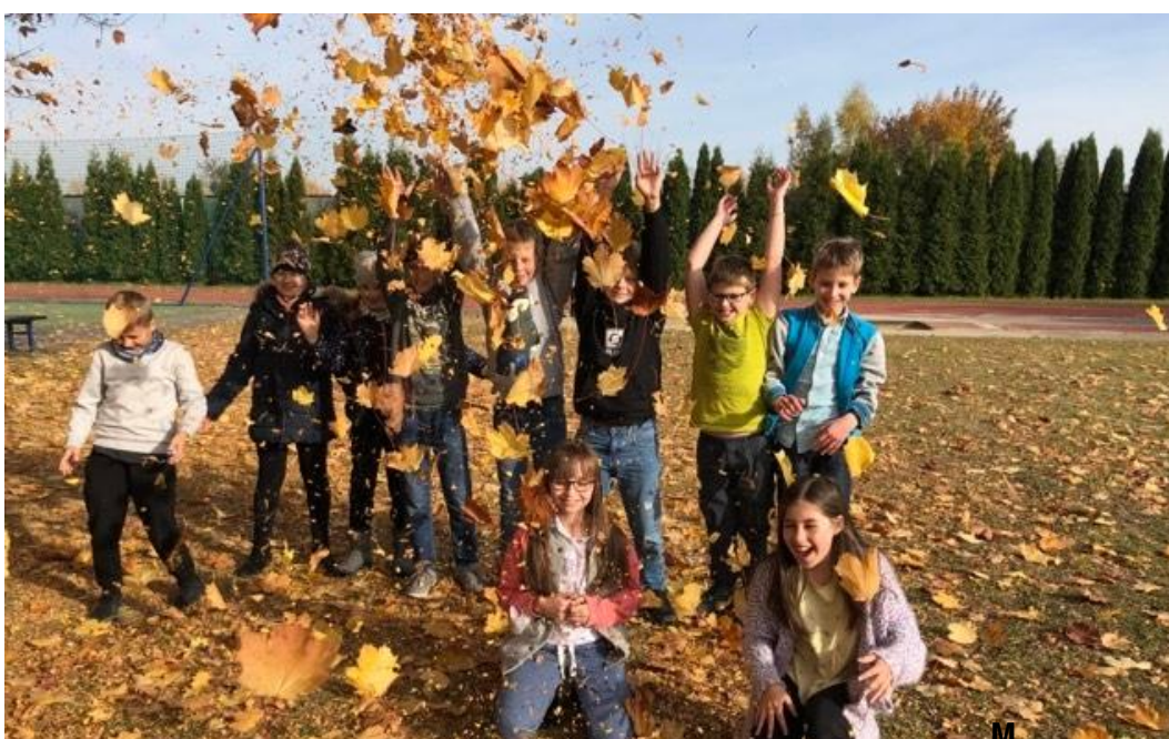
Liście na głowie potargał wiatr