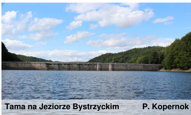
Tama na Jeziorze Bystrzyckim P. Kopernok