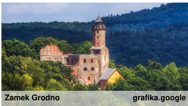
Zamek Grodno grafika.google