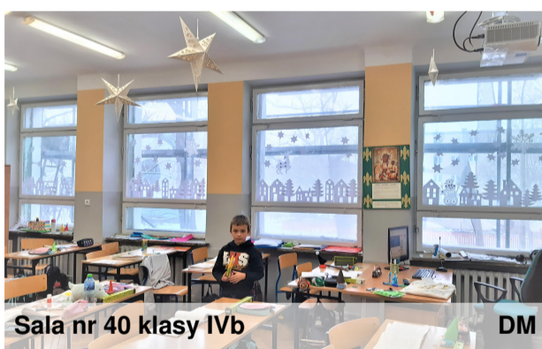
Sala nr 40 klasy IVb