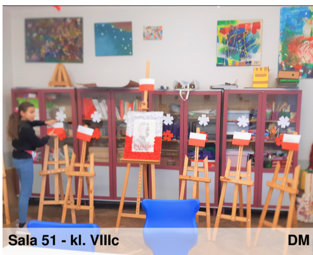
Sala 51 - kl. VIIIc