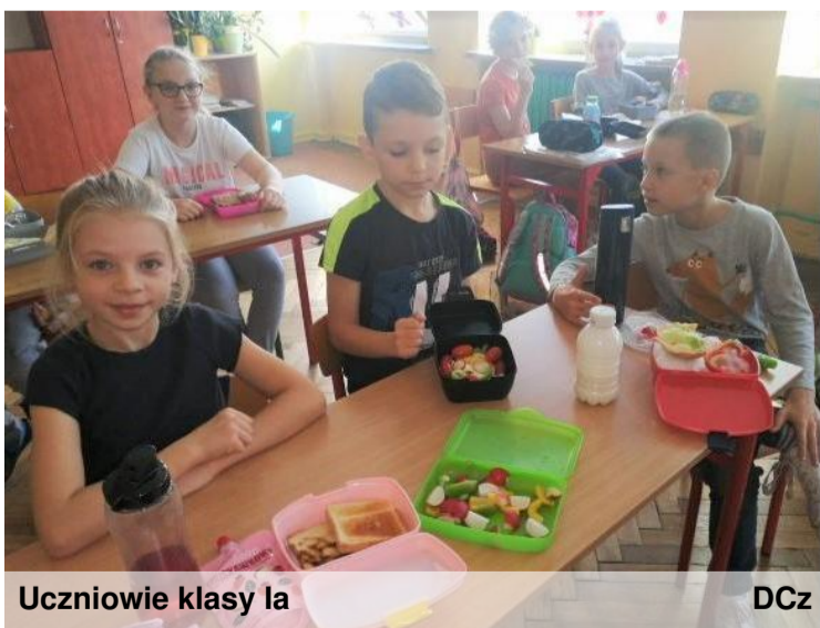
Uczniowie klasy Ia