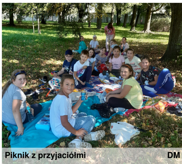
Piknik z przyjaciółmi

https://www.juniormedia.pl/newsy-melchiora www.szkoly: https://sp58lodz.edu.pl/ kontakt: d.michalus@sp58.elodz.edu.pl