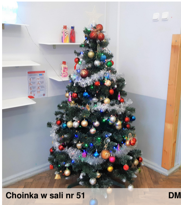
Choinka w sali nr 51