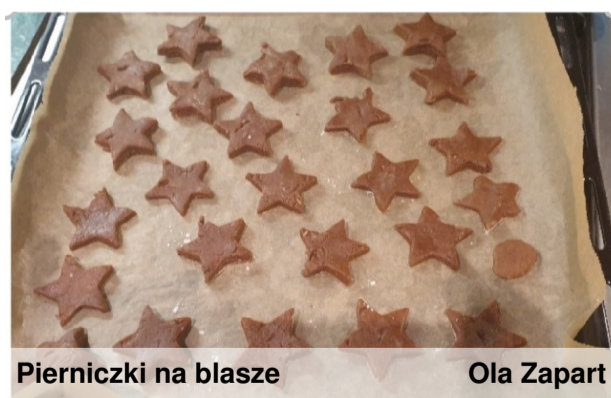
Pierniczki na blasze