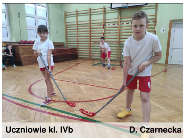
Uczniowie kl. IVb