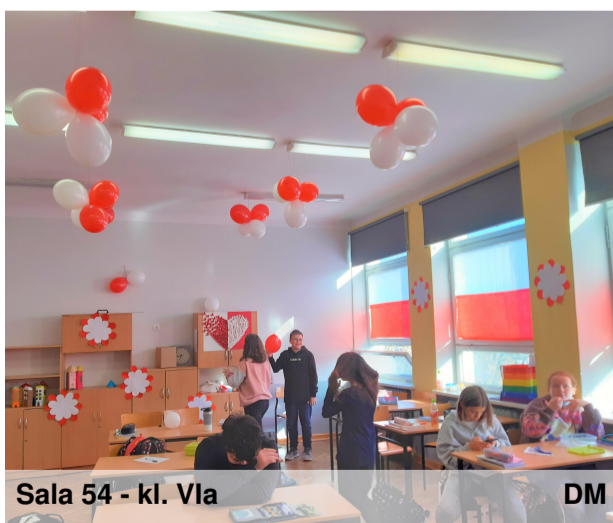
Sala 54 - kl. VIa