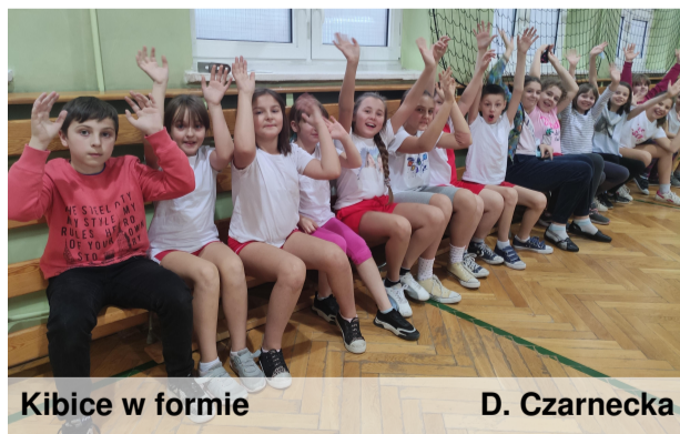
Kibice w formie