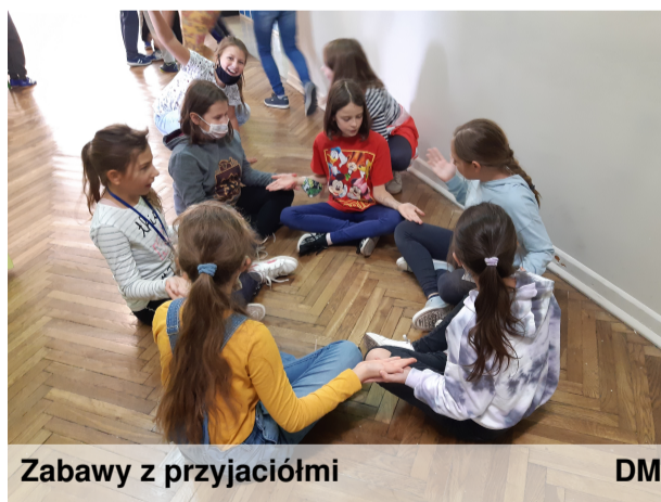
Zabawy z przyjaciółmi