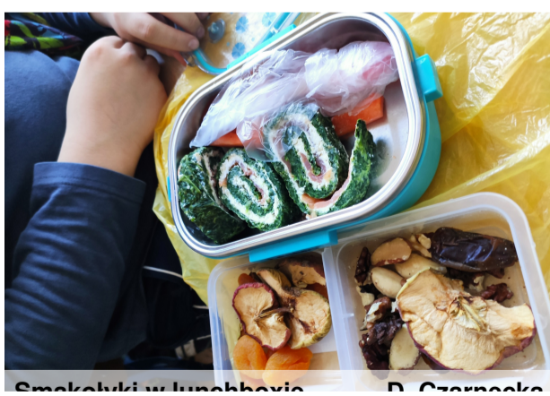
Smaczki w lunchboxie D. Czarnecka