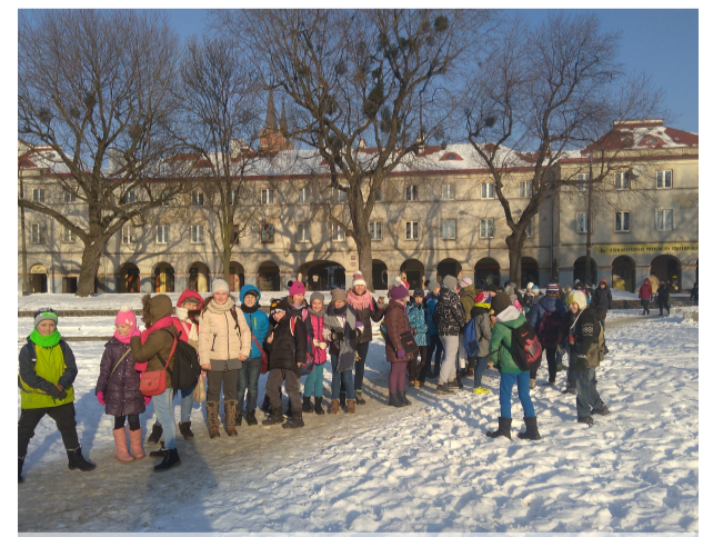
Zima, czas kolęd