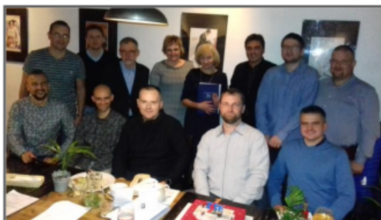
Spotkanie klasy V E, która ukończyła naszą szkołę w 2004 r.

Pamiętamy o Absolwentach, a oni pamiętają o nas