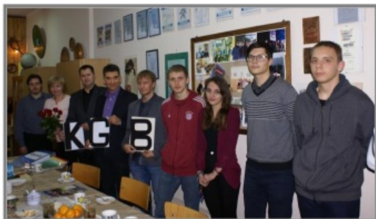
W redakcji zachował się oryginalny napis KGB

A zatem, zgodnie z wypracowanym zwyczajem, punktualnie wchodzimy od strony ul. Dauna na teren szkoły. To samo ogrodzenie, to samo boisko szkolne.