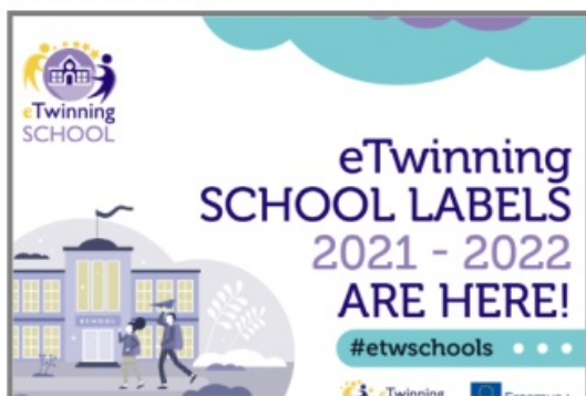
Odznaka Szkoła eTwinning 2021/2022

W bieżącym roku szkolnym nasza szkoła została wyróżniona Odznaką Szkoły eTwinning. Przyznano je 55 polskim placówkom na lata 2021/2022 jako oficjalne potwierdzenie dla szkoły jej zaangażowania i gotowości do współpracy europejskiej. Nagrodzone tą odznaką szkoły to pionierzy i liderzy w takich dziedzinach, jak praktyka cyfrowa, praktyka w zakresie eBezpieczeństwa, twórcze i innowacyjne podejścia do nauczania, promowanie ustawicznego rozwoju zawodowego kadry, promowanie praktyk uczenia się opartych na współpracy wśród nauczycieli i uczniów.