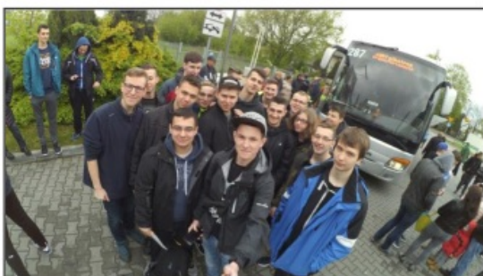
W drodze do Portsmouth

Zagraniczna praktyka miała przygotować uczniów do pracy zawodowej i zwiększyć ich szanse na zatrudnienie w przyszłości oraz przygotować do sprawnego funkcjonowania we współczesnym świecie. Projektem objętych było 62 uczniów sześciu klas trzecich Technikum Elektryczno-Elektronicznego. Odbyli oni praktyki zawodowe w Wielkiej Brytanii i w Niemczech.