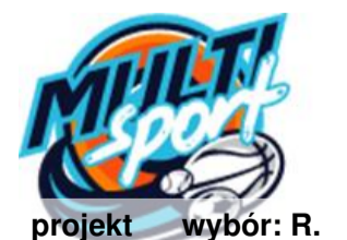
projekt wybór: R.