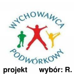
projekt wybór: R.