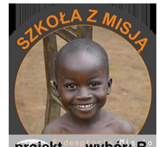
projekt wybór: R.