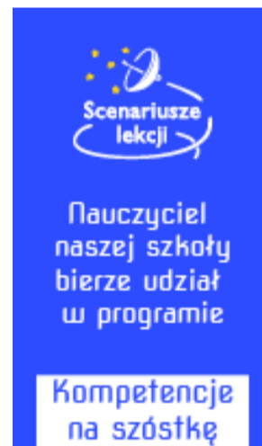
Kompetencje na szóstkę