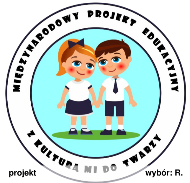
projekt wybór: R.