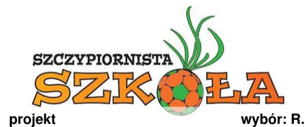
projekt wybór: R.