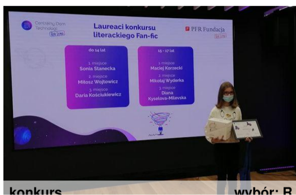
konkurs wybór: R.