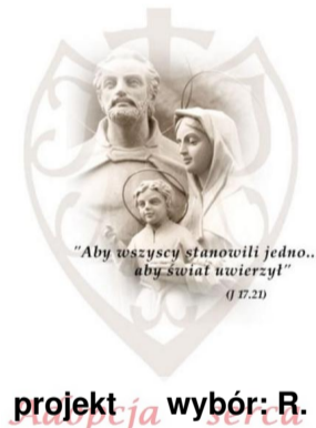
projekt wybór: R.