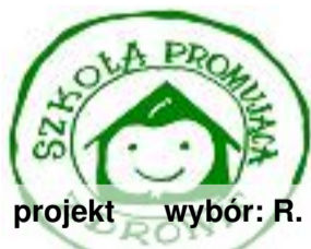
projekt wybór: R.