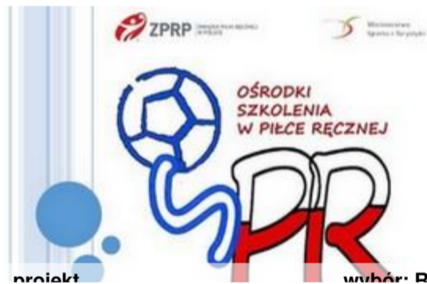
projekt wybór: R.