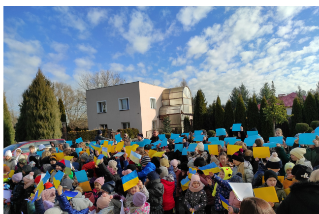
Solidarni z Ukrainą