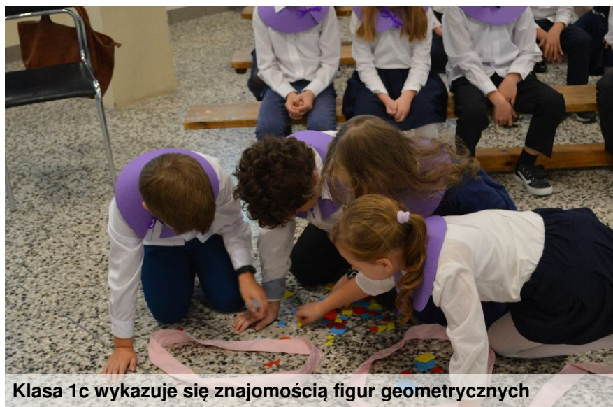
Klasa 1c wykazuje się znajomością figur geometrycznych