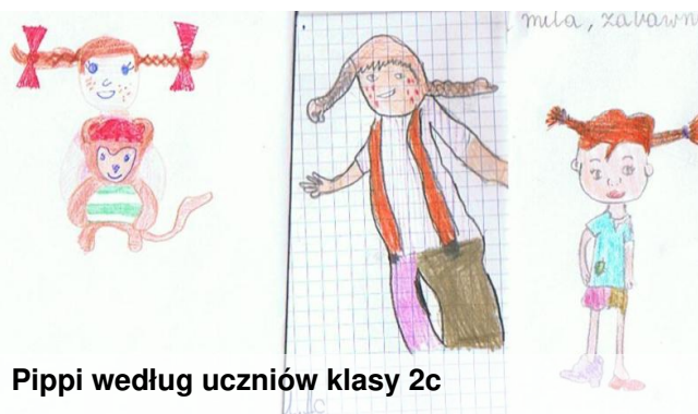
Pippi według uczniów klasy 2c