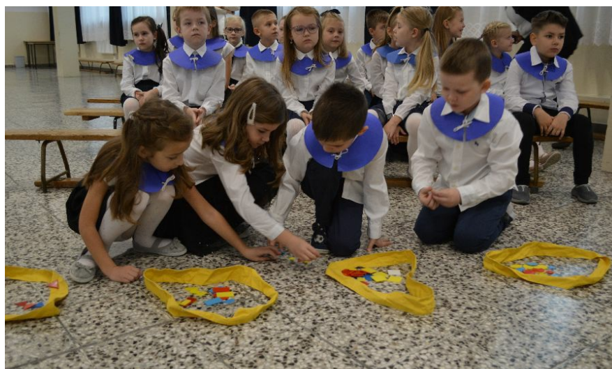
Praca grupowa uczniów kl. 1b chyba się udała