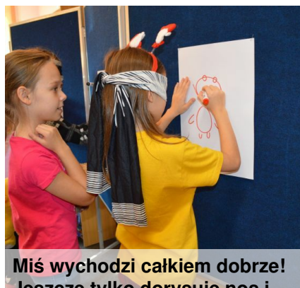
Miś wychodzi całkiem dobrze! Jeszcze tylko dorysuję nos i... gotowy. Chętni mogli sobie zrobić zdjęcie w misiowej fotobudce.