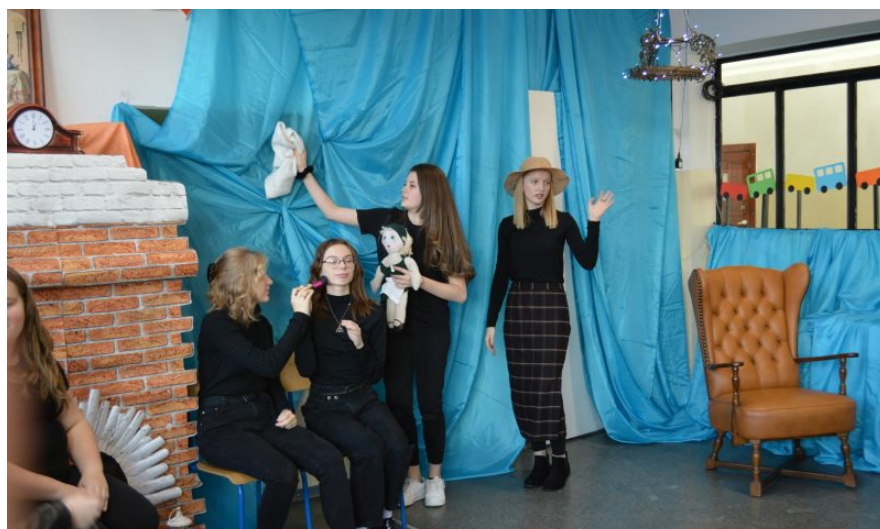
Kopciuszek tylko sprzątał, i sprzątał, a tymczasem siostry...