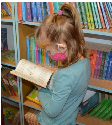
Chyba mi się ta książka podoba. Biorę ją!