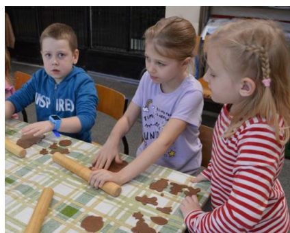
Nasze pierniczki będą najlepsze

Uczniowie klasy 2c 16 grudnia wzięli udział w świątecznych warsztatach pieczenia pierników prowadzonych przez przedstawicieli Krainy Rumianku.