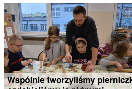
Wspólnie tworzyliśmy pierniczki ozdabialiśmy je różnymi posypkami wedle uznania, ale piec pomagał nam nasz gość.