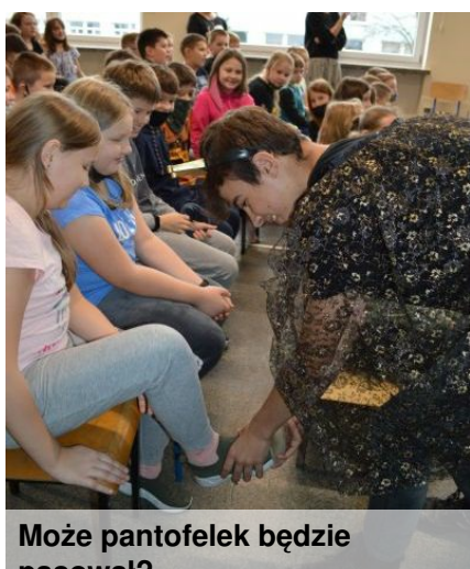
Może pantofelek będzie pasował?