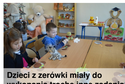
Dzieci z zerówki miały do wykonania trochę inne zadania. Tutaj tworzą bużki niedźwiadków.

Pod koniec 2021 roku biblioteka szkolna pozyskała środki pieniężne w kwocie 15.000 zł z Narodowy Programu Rozwoju Czytelnictwa 2.0. na lata 2021-2025. Zakupiono 520 książek, kolorową drukarkę, tablicę do ekspozycji wystaw oraz wyposażenie kąjka czytelniczego dla najmłodszych dzieci w wygodne siedziska. Część kwoty przeznaczono na nagrody w konkursach.