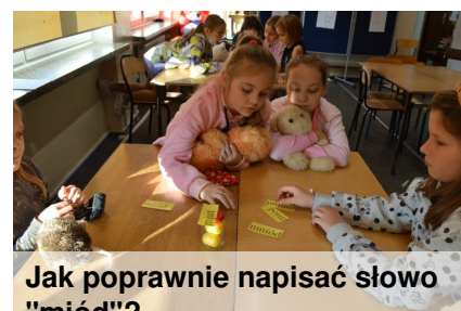
Jak poprawnie napisać słowo "miód"?