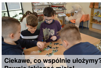
Ciekawe, co wspólnie ułożymy? Pewnie jakiegoś misia!

Pod koniec 2021 roku biblioteka szkolna pozyskała środki pieniężne w kwocie 15.000 zł z Narodowy Programu Rozwoju Czytelnictwa 2.0. na lata 2021-2025. Zakupiono 520 książek, kolorową drukarkę, tablicę do ekspozycji wystaw oraz wyposażenie kąjka czytelniczego dla najmłodszych dzieci w wygodne siedziska. Część kwoty przeznaczono na nagrody w konkursach.