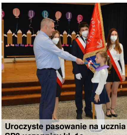
Uroczyste pasowanie na ucznia SP3 uczniocy kl. 1c