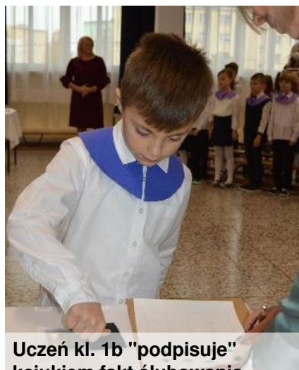
Uczeń kl. 1b "podpisuje" kciukiem fakt ślubowania