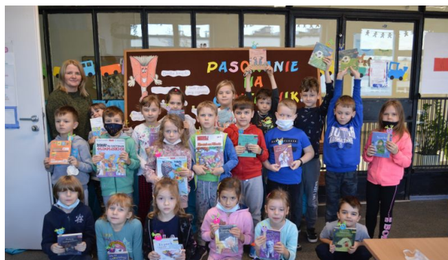
Nowi czytelnicy z klasy 1c z wybranymi pierwszymi książeczkami, które dzieci zabrają do domu

Dużo radości wzbudził bał na zamku (w którym wzięli udział widzowie), jak i mierzenie bucika, zgubionego przez nieznaną. Mierzyły go i panie z biblioteki, i wychowawczynie, i niektórzy widzowie, no i oczywiście wszystkie córki złej macochy! Niestety, pantofelek pasował tylko na nogę Kopciuszka.