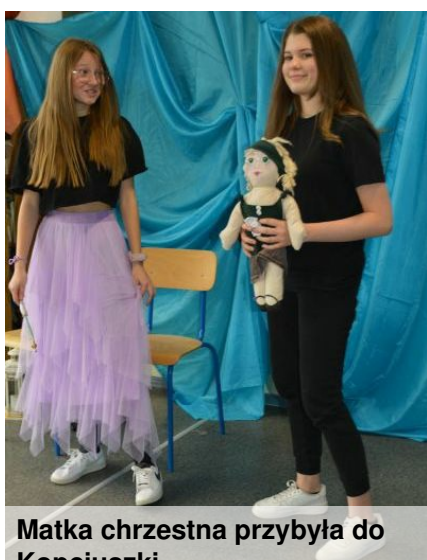
Matka chrzestna przybyła do Kopciuszki