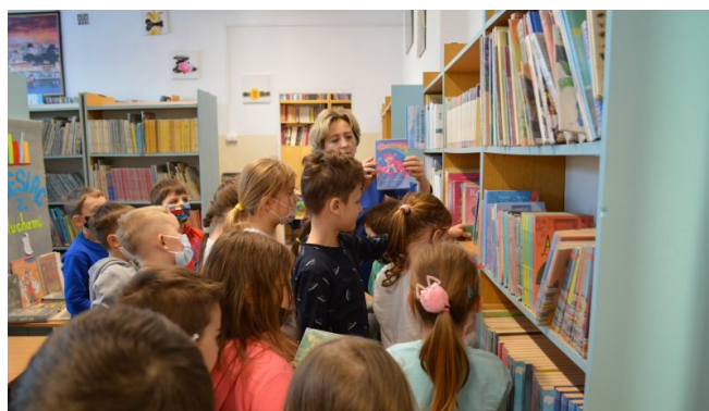
Jaką książkę sobie wybrać? Mamy bardzo duży wybór!