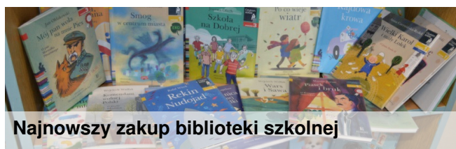
Najnowszy zakup biblioteki szkolnej