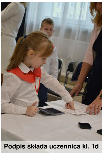
Podpis składa uczennica kl. 1d