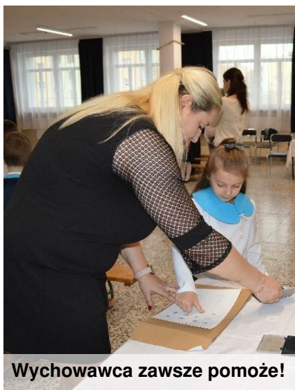
Wychowawca zawsze pomoże!