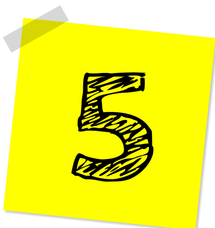
Endemiczna klasa piąta!