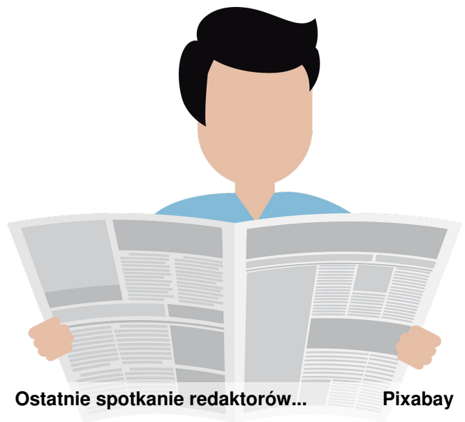
Ostatnie spotkanie redaktorów...