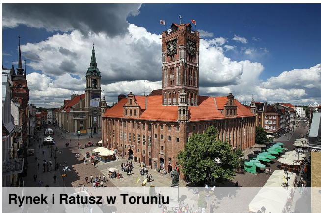
Rynek i Ratusz w Toruniu