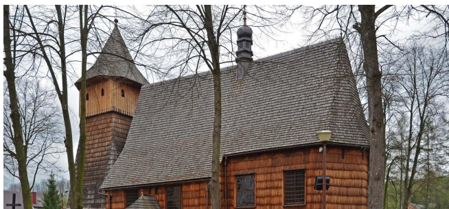
Kościół św. Michała Archanioła w Binarowej