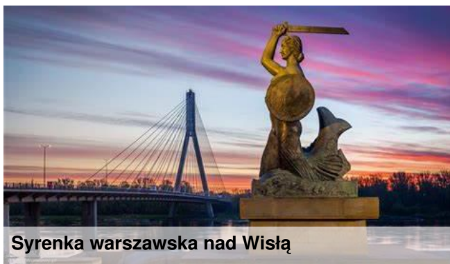
Syrenka warszawska nad Wisłą