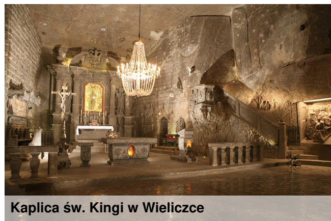
Kaplica św. Kingi w Wieliczce

Największym podziemnym kościołem jest znajdująca się na głębokości 101 metrów Kaplica św. Kingi o wymiarach: długość ok. 54 metrów, szerokość ok. 18 metrów oraz wysokość ok. 12 metrów. Znajdują się tutaj relikwie uznanej za świętą królowej Polski.