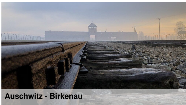
Auschwitz - Birkenau