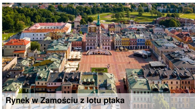
Rynek w Zamościu z lotu ptaka