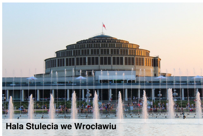
Hala Stulecia we Wrocławiu