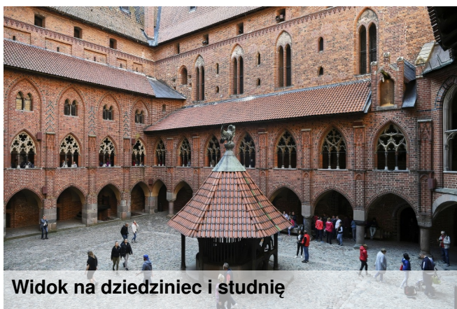
Widok na dziedziniec i studnię