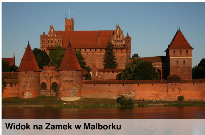
Widok na Zamek w Malborku