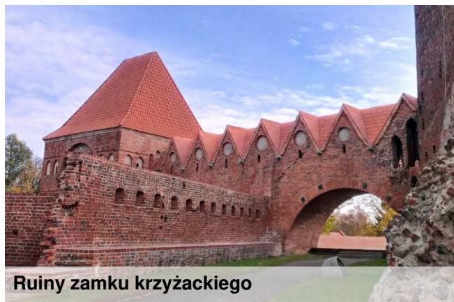
Ruiny zamku krzyżackiego