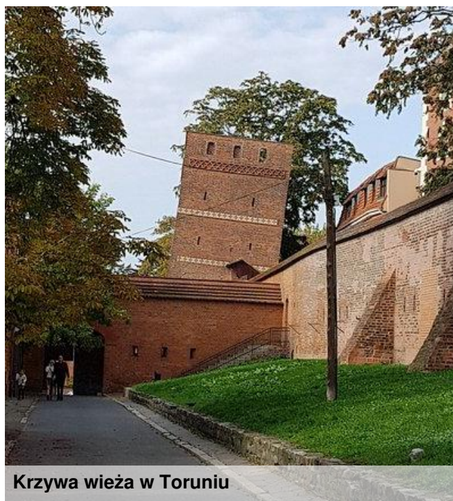
Krzywa wieża w Toruniu