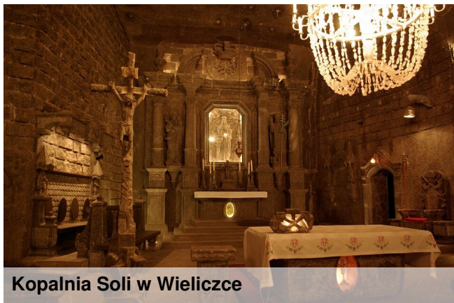
Kopalnia Soli w Wieliczce