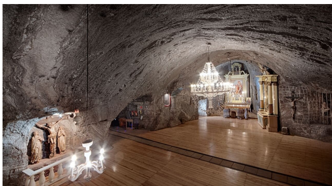
Kopalnia Soli w Bochni