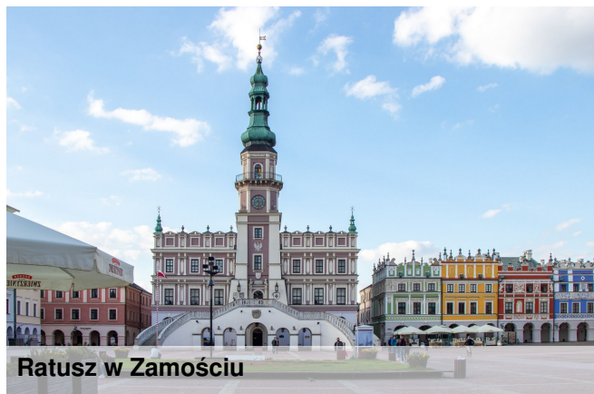
Ratusz w Zamościu