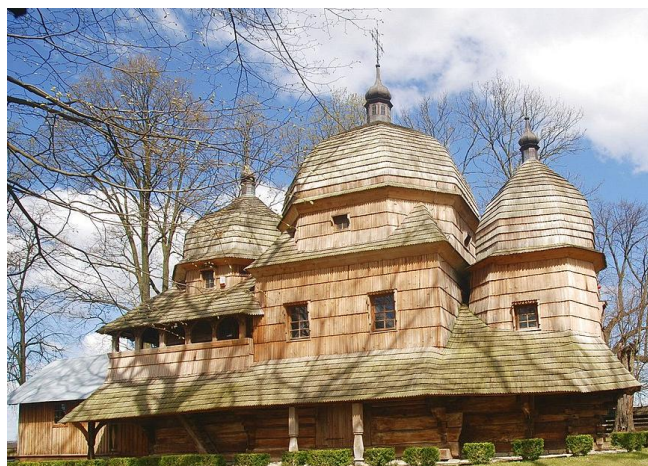
Cerkiew Narodzenia Przenajświętszej Bogurodzicy w Chotyńcu