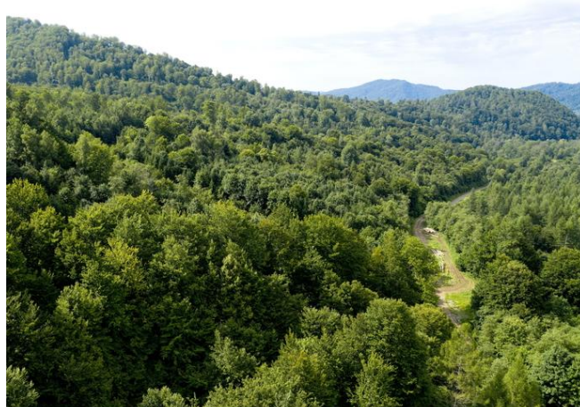
Bukowe lasy w Bieszczadach