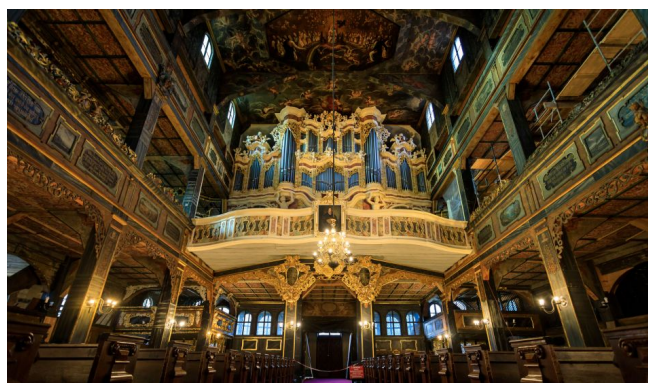
Wnętrze Kościoła Pokoju w Świdnicy