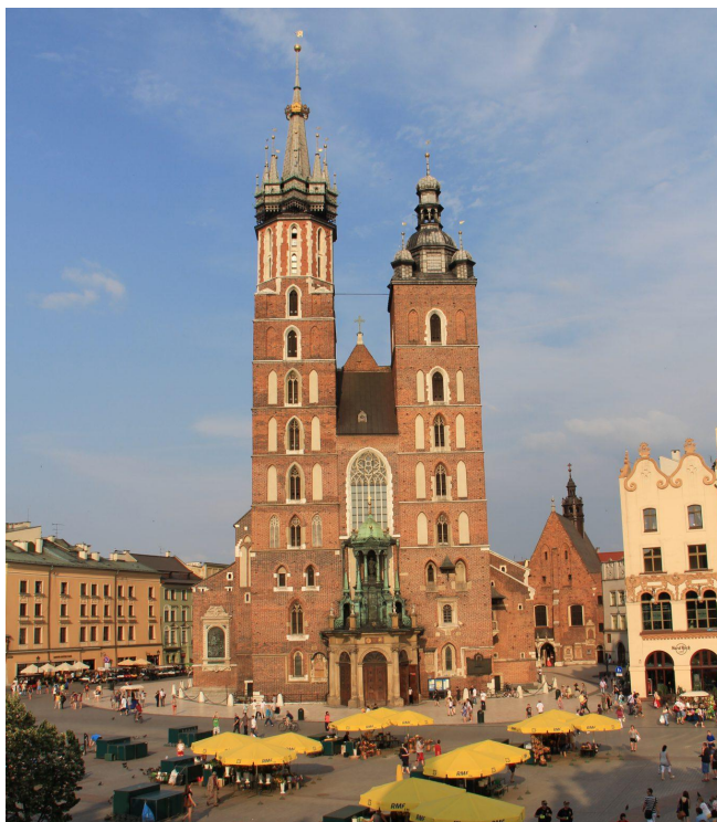
Rynek w Krakowie