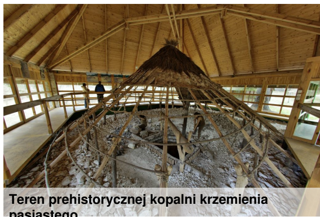
Teren prehistorycznej kopalni krzemienia pasiastego