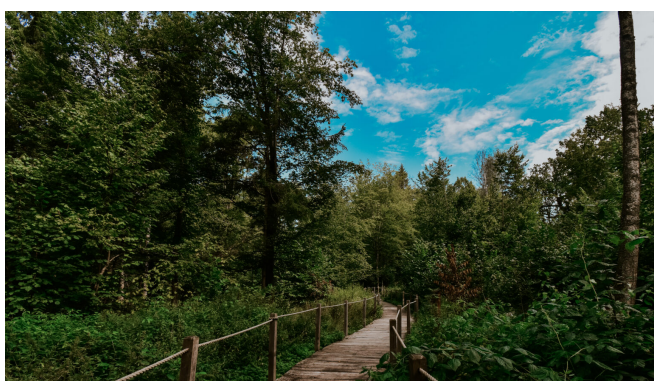
Szlak dla pieszych