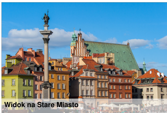
Widok na Stare Miasto