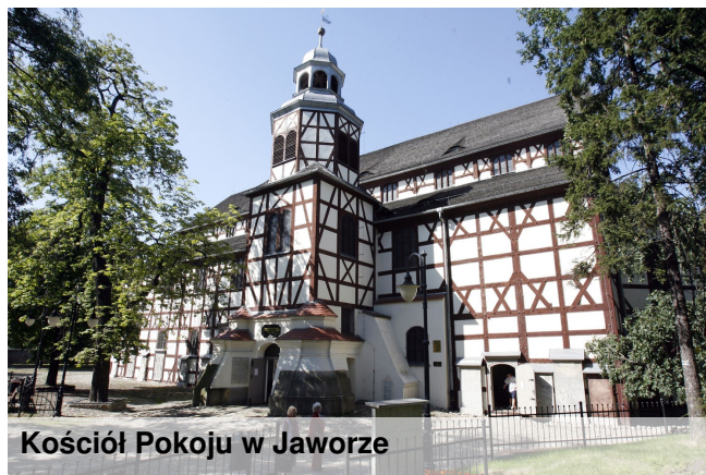
Kościół Pokoju w Jaworze