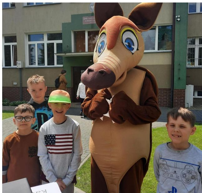
Spotkanie z pancernikiem ;)