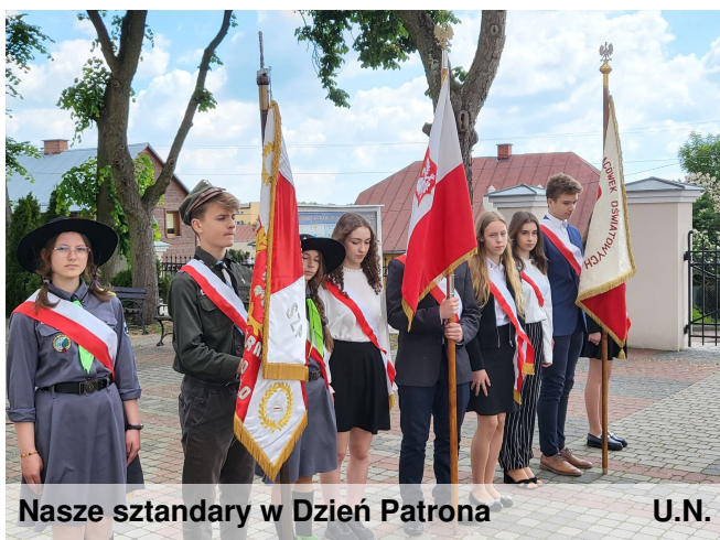
Nasze sztandary w Dzień Patrona