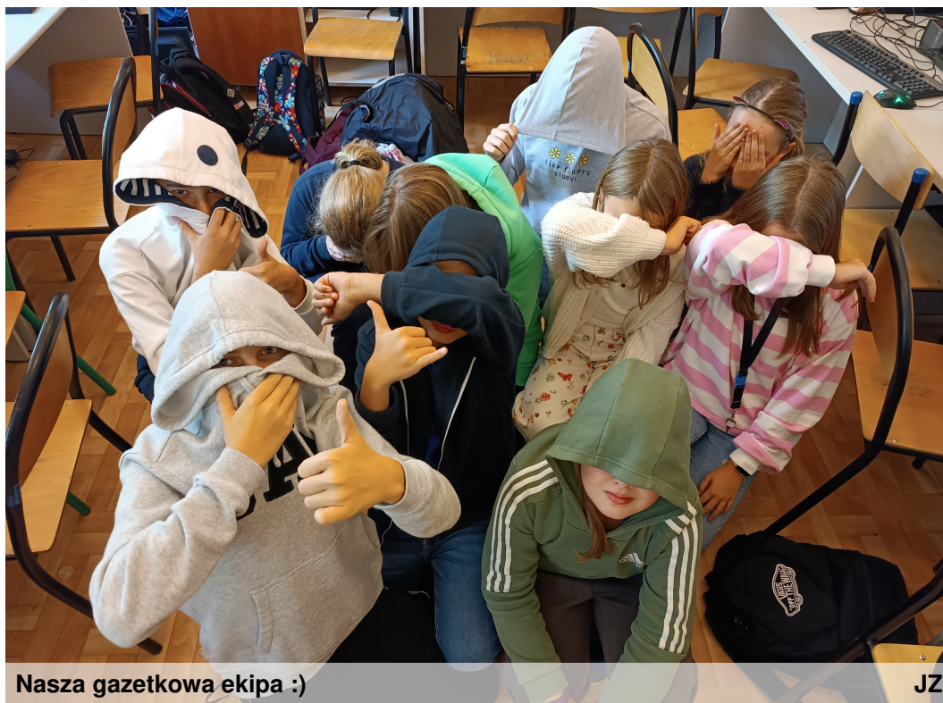
Nasza gazetkowa ekipa :)