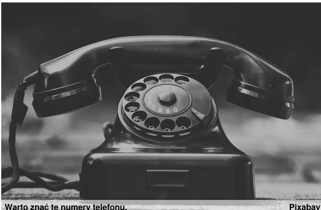
Warto znać te numery telefonu.