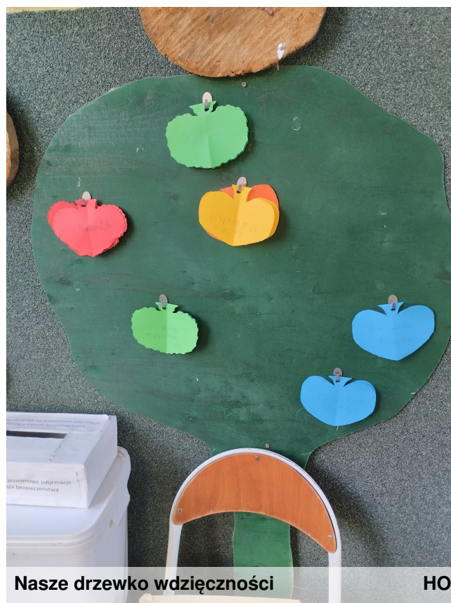
Nasze drzewko wdzięczności