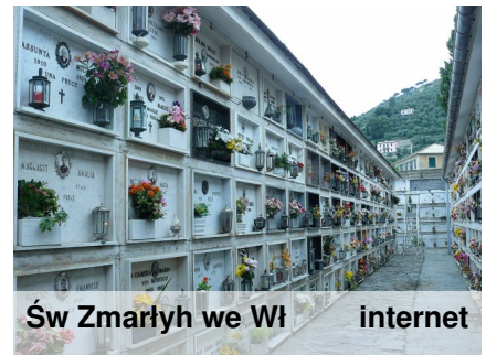
Św Zmarłych we Wł

Meksykanie wierzą, że od północy 31 października dusze zmarłych dzieci schodzą na Ziemię z nieba i ponownie łączą się ze swymi rodzinami w dniu 1 listopada, a dusze zmarłych dorosłych przychodzą z wizytą 2 listopada. Święto Zmarłych traktuje się w Meksyku jako powód do radości i miłych wspomnień.