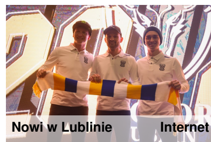
Nowi w Lublinie

Bartosz Zmarzlik przechodzi z Moje Bermudy Stal Gorzów do Motoru Lublin. Jack Holder i Fredrik Lindgren zdecydowali się też reprezentować lubelskie barwy drużyny z koziołkiem. Michelsen i Maksym Drabik opuszczają Motor Lublin i będą reprezentować Włókniarza Częstochowę.