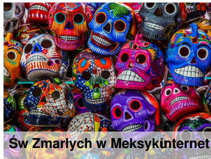
Św Zmarłych w Meksykinternet

Święto Zmarłych (Wszystkich Świętych) obchodzimy 1 listopada w celu upamiętnienia osób, które odeszły. W tym dniu chodzimy na cmentarz i zapalamy znicze, zostawiamy kwiaty na grobach lub po prostu odwiedzamy naszych bliskich zmarłych. 2 listopada obchodzimy Zaduszki.