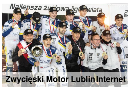
Zwycięski Motor LublinInternet