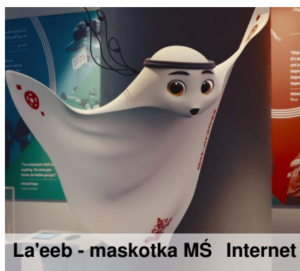
La'eeb - maskotka MŚ Internet

Mieliśmy nadzieję, że nasza reprezentacja wyjdzie z grupy i udało się! Teraz mecz z Francją i marzenia o grze w półfinale (13 albo 14 grudnia), a później w finale, który odbędzie się 18 grudnia.