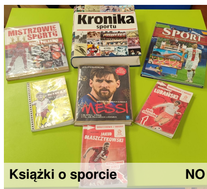
Książki o sporcie

Dawid Kubacki nadal jest liderem Pucharu Świata 2022/23. Dawid Kubacki przystąpił do sobotniego konkursu Pucharu Świata jako lider cyklu - z dorobkiem 200 punktów. W zawodach w Ruce dołożył 90"oczek" i ma 5 punktów przewagi nad drugim- Stefanem Kraftem. 54 punkty do lidera traci Anze Lanizsek.