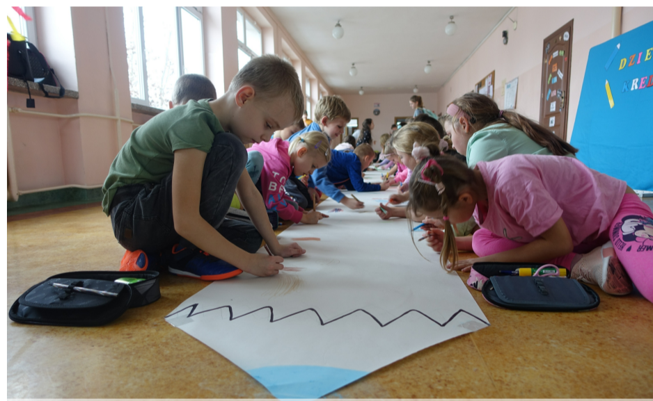
Dzień kredki PG