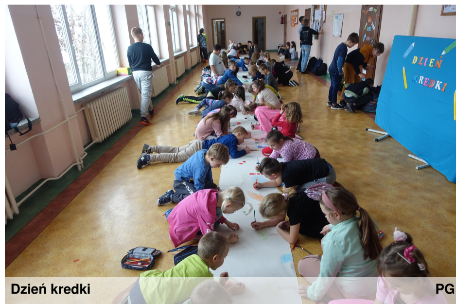
Dzień kredki PG