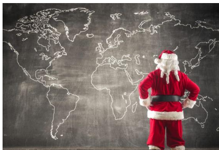
Święta bożego Narodzenia (innych krajach)

Tradycyjne święta w Etiopii obchodzone są według starożytnego kalendarza juliańskiego, dlatego Święto Bożego Narodzenia przypada na 7 stycznia. Wtedy przez całą noc procesje wędrują od kościoła do kościoła. Podczas trwania tych nabożeństw kapłani i wierni śpiewają, grają na instrumentach i tańczą. Tradycyjną potrawą w tym kraju jest pikantny gulasz podawany z lokalnym pieczywem o nazwie indżera. Ucztom towarzyszy również też, czyli napój alkoholowy na bazie miodu. Święto poprzedzone jest trwającym 43 dni postem.