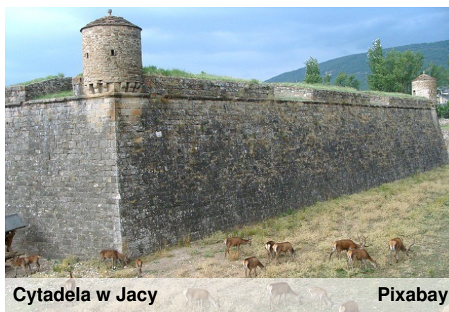
Cytadela w Jacy