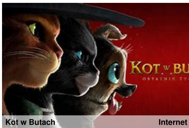
Kot w Butach