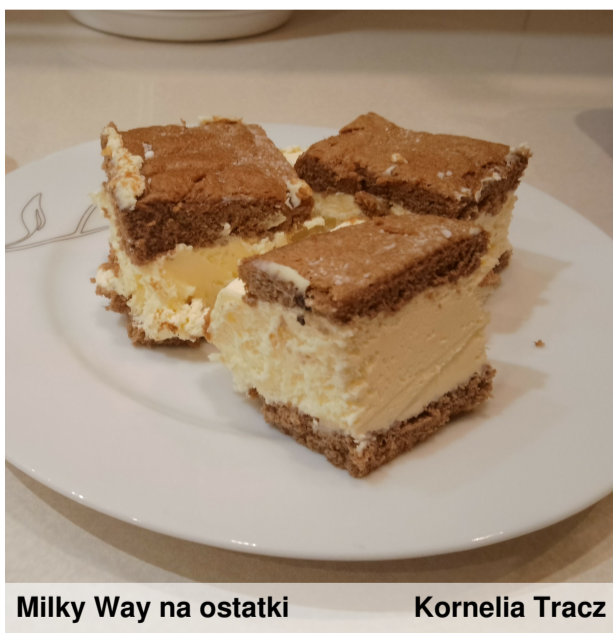
Milky Way na ostatki