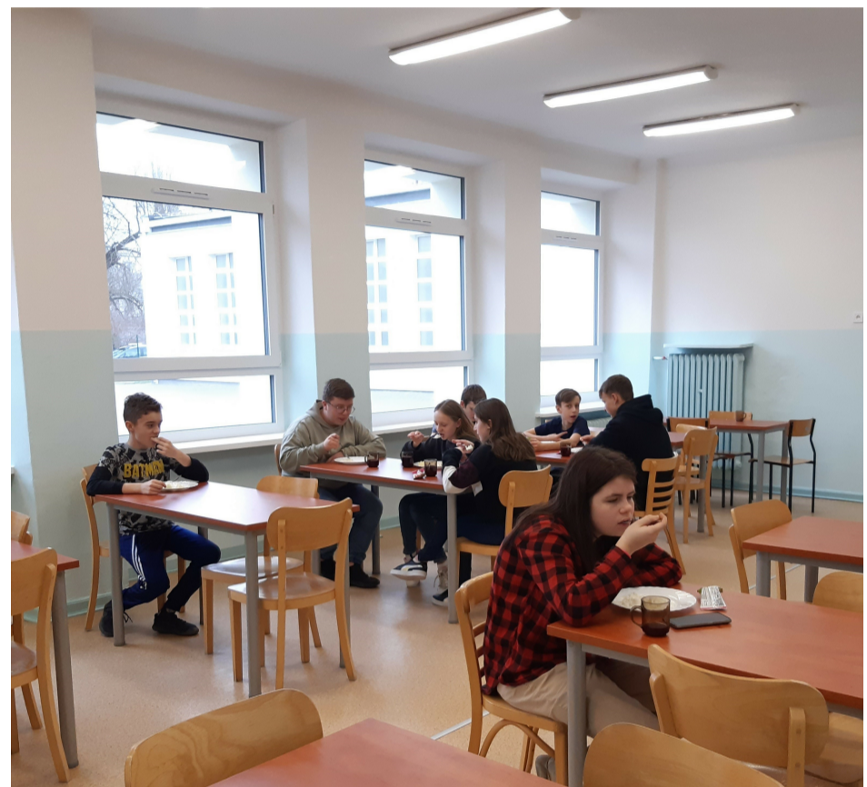
My, uczniowie kl. VIII, domagamy się większych porcji obiadowych DM