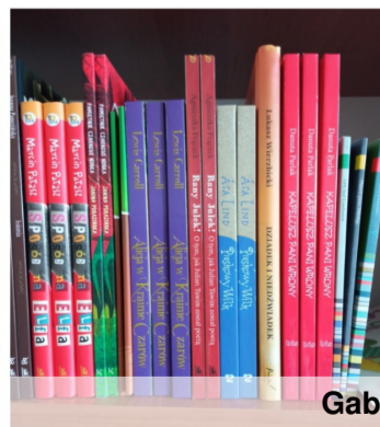
Nowości czytelnictw w naszej bibliotece