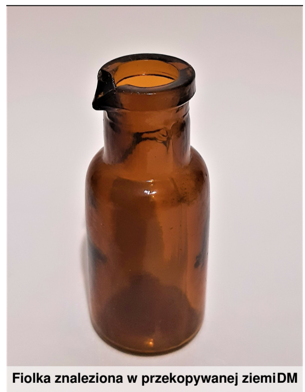
Fiolka znaleziona w przekopywanej ziemi DM

Cześć, tu Wasz redaktor Jasiek. Jakiś czas temu pomagałem mamie sprzątać piwnicę. Znaleźliśmy tam starą gazetę, a dokładnie jedną jej stronę. Jest to gazeta „Express Ilustrowany” - wydanie z soboty na niedzielę 22-23 kwietnia 1972 roku. Bardzo zainteresował mnie artykuł pod tytułem „Kosmonauci odrabiają opóźnienie w wykonaniu planu badań na księżycu”. Tekst opowiadał o dwóch amerykańskich astronautach statku Apollo 16, którzy mieli wykonać trzy spacerunki po Księżycu. W artykule opisany był szczegółowy plan ich działania. Znalaziona w piwnicy gazeta przeniosła mnie w czasie i na inną planetę. Dlatego warto pomagać i nie wyrzucać niczego, co stare, bo może mieć wielką wartość, nawet piękną. Janek Olizorowicz