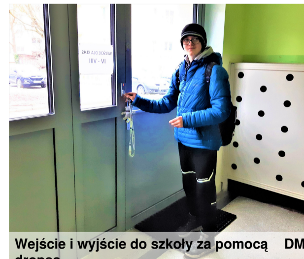
Wejście i wyjście do szkoły za pomocą drobsa