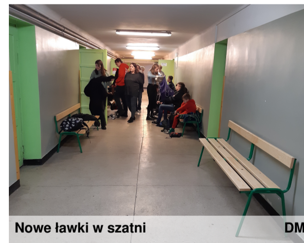
Nowe ławki w szatni