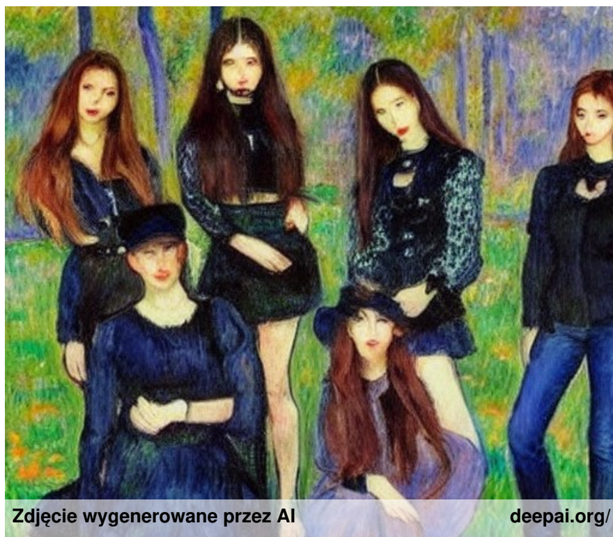
Zdjęcie wygenerowane przez AI