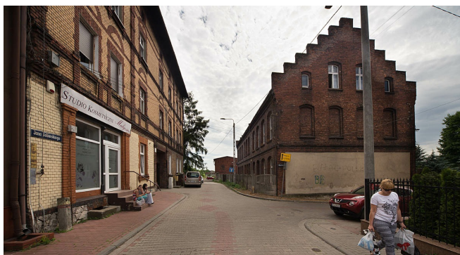
Ul. Jana III Sobieskiego