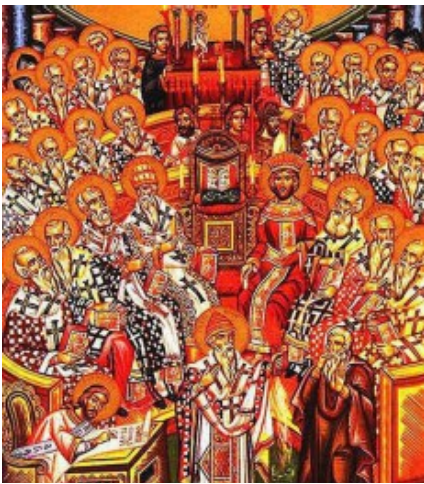
Ikona ukazująca Sobór Nicejski z 325 roku, czyli ten ważny moment dla chrześcijan

Czy wniósł coś nowego? Czy już wszystko wiecie?