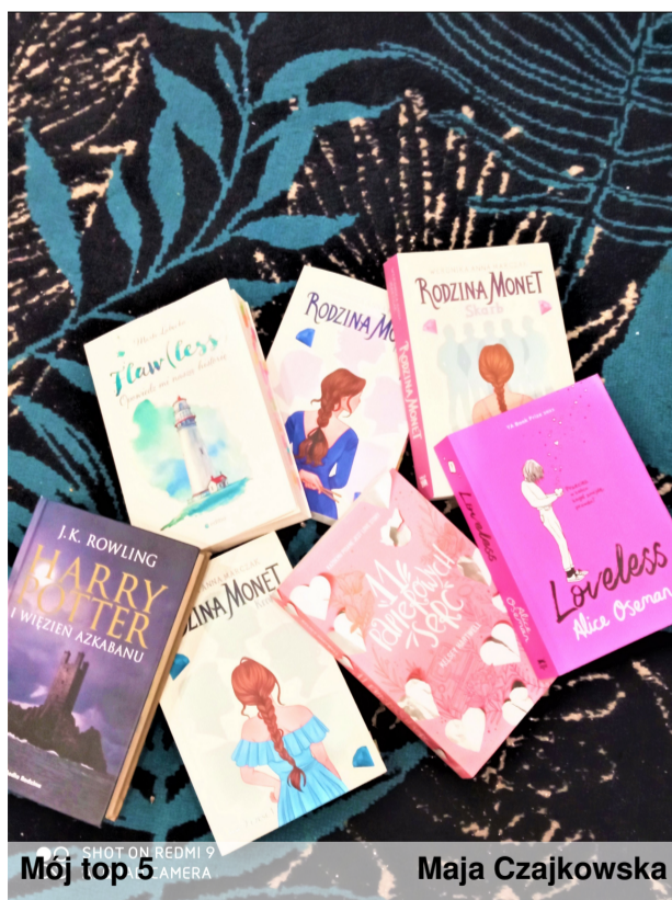
Mój top 5