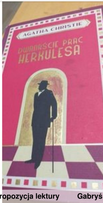
Moja propozycja lektury Gabrys Samuła