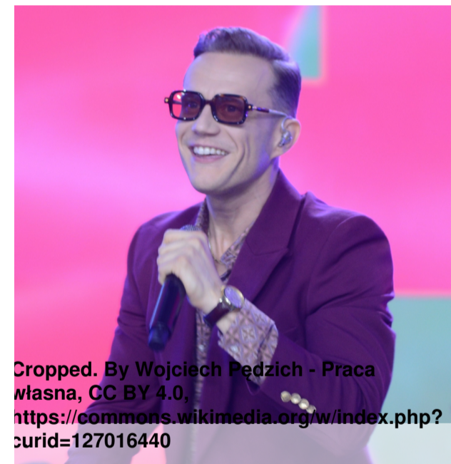
Cropped.

PS dla zainteresowanych! Kolejne książki z tej serii, to: “Błądny rycerz”, “Strażnicy kryształów”, “Tkacze śmierci”, “Skoczkowie w czasie”.