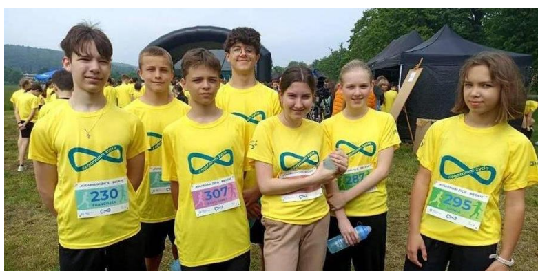
Uczestnicy biegu z SP 41

26 maja na Błoniach w Krakowie prawie 400 uczniów z 40 krakowskich szkół podstawowych, realizujących pilotażowy projekt miejski pod hasłem „Ogarniam życie”, wzięło udział w biegu na dystansie 1500 m, wśród nich siedmioro reprezentantów SP 41. Tę imprezę zorganizowali Krakowski Szkolny Ośrodek Sportowy im. Szarych Szeregów i Wydział Edukacji Urzędu Miasta Krakowa. W klasyfikacji indywidualnej najszybsi uczniowie zdobyli medale i nagrody rzeczowe (lokaty 1-6 dziewcząt i lokaty 1-6 chłopców), a za miejsca na podium w klasyfikacji drużynowej szkoły otrzymały vouchery na sprzęt sportowy o wartości 2500 zł, 2000 zł i 1500 zł.