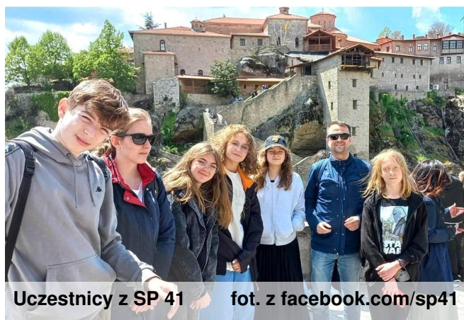
Uczestnicy z SP 41