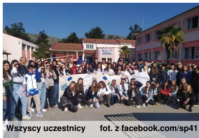
Wszyscy uczestnicy