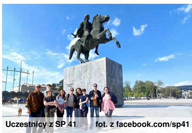
Uczestnicy z SP 41