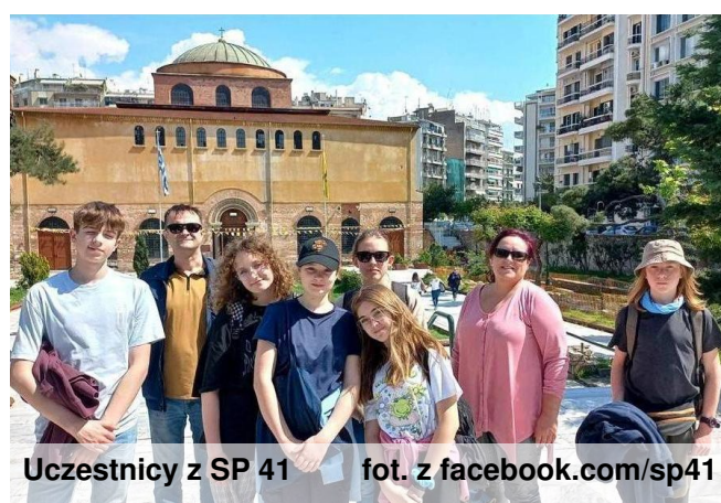
Uczestnicy z SP 41