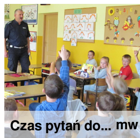
Czas pytań do... mw

Nasza szkoła organizuje corocznie spotkania z policjantem, który przestrzega nas o niebezpieczeństwach czyhających na drogach. Pamiętaj, że możesz przejść przez ulicę na pasach. Nigdy nie przechodź na zakręcie lub nad wzniesieniem. Aby być bezpiecznym na plecaku noś odblaski i zawsze poruszaj się chodnikiem lub poboczem! Nie popychaj na drodze innych ponieważ może się to tragicznie skończyć.