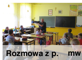
Rozmowa z p. mw

Chłopak to stworzenie takie, co to bywa różnorakie!