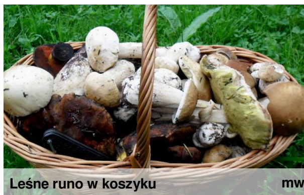
Leśne runo w koszyku

Jeśli mamy jakiegokolwiek wątpliwości, czy wszystkie zebrane grzyby są jadalne, dla bezpieczeństwa wyrzucmy je!