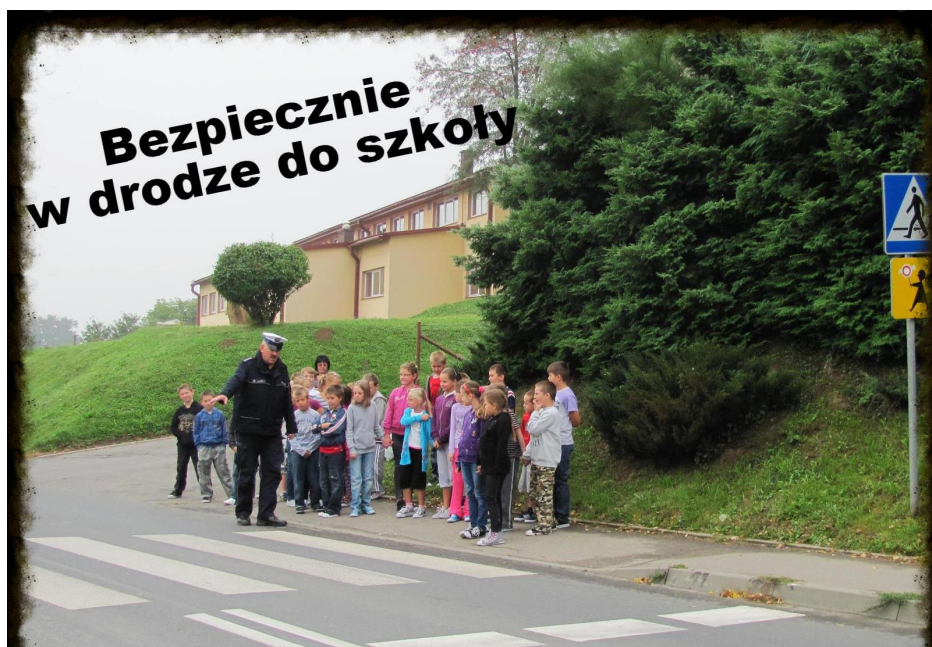
Ćwiczenia z policjantem - Przechodzimy przez jezdnię

we wszystkich rodzajach broni oraz zastosowanie taktyki „blitzkriegu”, czyli wojny błyskawicznej. Polegała ona na uderzeniach licznych jednostek pancernych w wybrane punkty, zwykle na styku armii polskich. Oddziały polskie jednak walczyły, aż do końca.