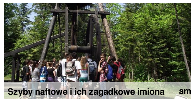
Szyby naftowe i ich zagadkowe imiona