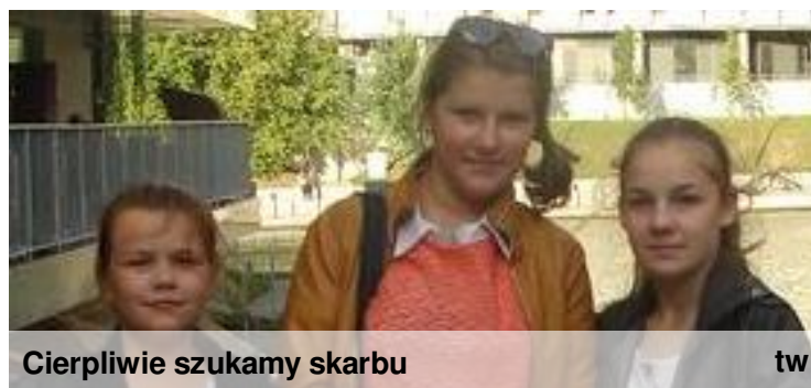
Cierpliwie szukamy skarbu tw