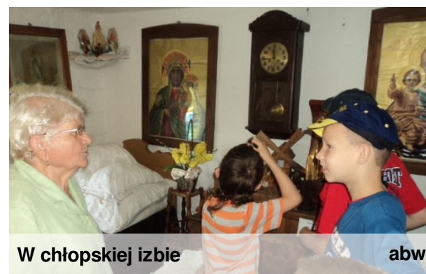
W chłopskiej izbie

Tym razem udaliśmy się do Bobrki, najstarszej kopalni ropy naftowej na świecie. Na początek, tuż po przyjeździe, wysłuchaliśmy prezentacji na temat życia oraz działalności Ignacego Łukasiewicza. Następnie uczestniczyliśmy w warsztatach. Nasze zadanie polegało na wycięciu i sklejeniu lampy naftowej z wcześniej przygotowanego szablonu. Wykonywanie lampy naftowej okazało się fajną zabawą i wszyscy chętnie w niej uczestniczyli. Następnie udaliśmy się z panem przewodnikiem zwiedzać muzeum. Każdy z nas miał możliwość obejrzenia szybów wydobywczych wykopanych dzięki pracy ludzkich rąk, w których do tej pory znajduje się ropa naftowa i w dalszym ciągu jest wydobywana. W dalszej kolejności zwiedziliśmy aptekę oraz biuro Ignacego Łukasiewicza. Na koniec obejrzelśmy filmy na temat wydobycia ropy naftowej i gazu ziemnego w Polsce i na świecie w teraźniejszych czasach.