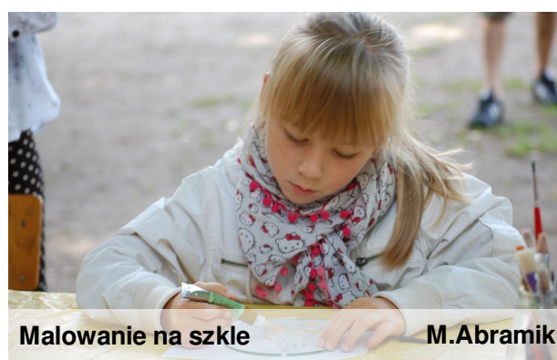
Malowanie na szkle M.Abramik