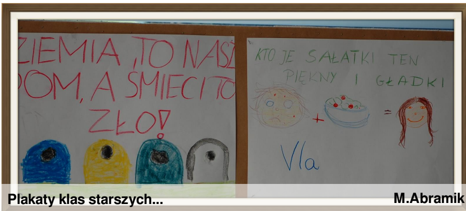
Plakaty klas starszych...