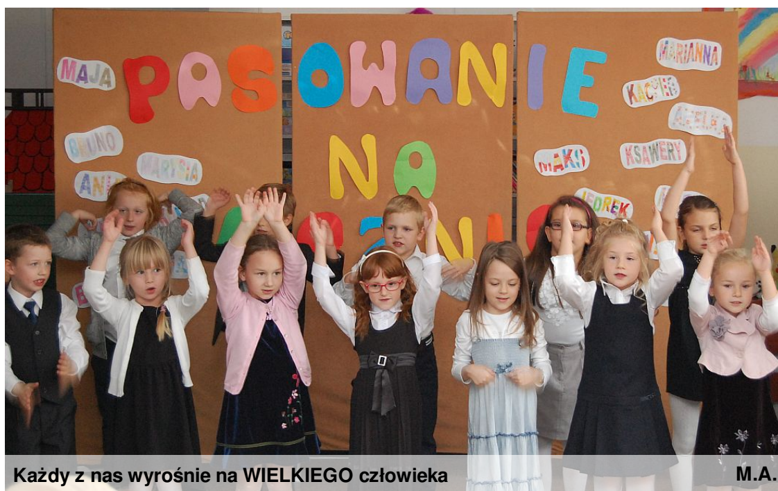
Każdy z nas wyrośnie na WIELKIEGO człowieka

"...Ślubujemy uczyć się pilnie, na miarę naszych możliwości. Ślubujemy również szanować kolegów i koleżanki..."