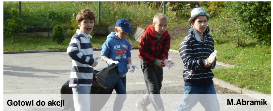
Gotowi do akcji

"Ekologiczne ludziki". To był naprawdę udany dzień ekologii. G.M.