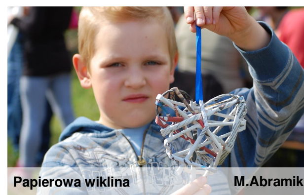
Papierowa wiklina M.Abramik