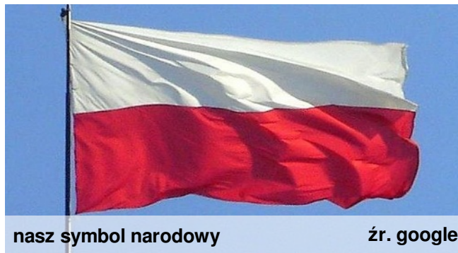
nasz symbol narodowy

Okazuje się, że jest wiele sytuacji w naszym życiu, kiedy możemy udowodnić, że kochamy swój kraj i jesteśmy patriotami. Na przykład wtedy, kiedy na muzyce z zapałem ucę się śpiewać pieśni patriotycznych, to budzi się we mnie duch patriotyzmu.