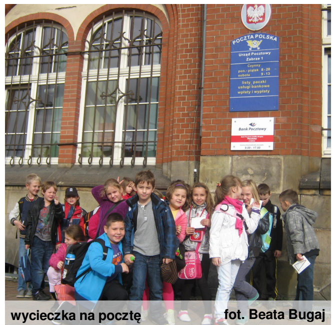
wycieczka na pocztę