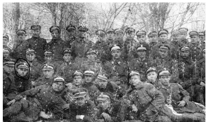
Oddział I prywatne archiwum J. Kasperek

Mundur był praktyczny, wygodny oszczędny. Kolor khaki był najodpowiedniejszy do warunków panujących na ziemiach polskich. Co ciekawe, żołnierze niechętnie odnieśli się do tej propozycji munduru, jednolite umundurowanie wszystkich jednostek wojskowych udało się wprowadzić dopiero pod koniec 1922r.