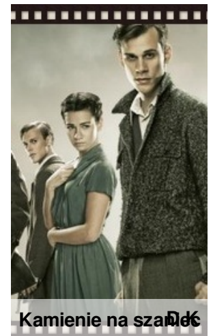
Kamienie na szaniec

Za efekty specjalne, kostiumy, rekwizyty, broń, itp. odpowiedzialna jest nowozelandzka firma WETA, ta sama, która pracowała przy ekranizacji "Władcy Pierścieni" Petera Jacksona .