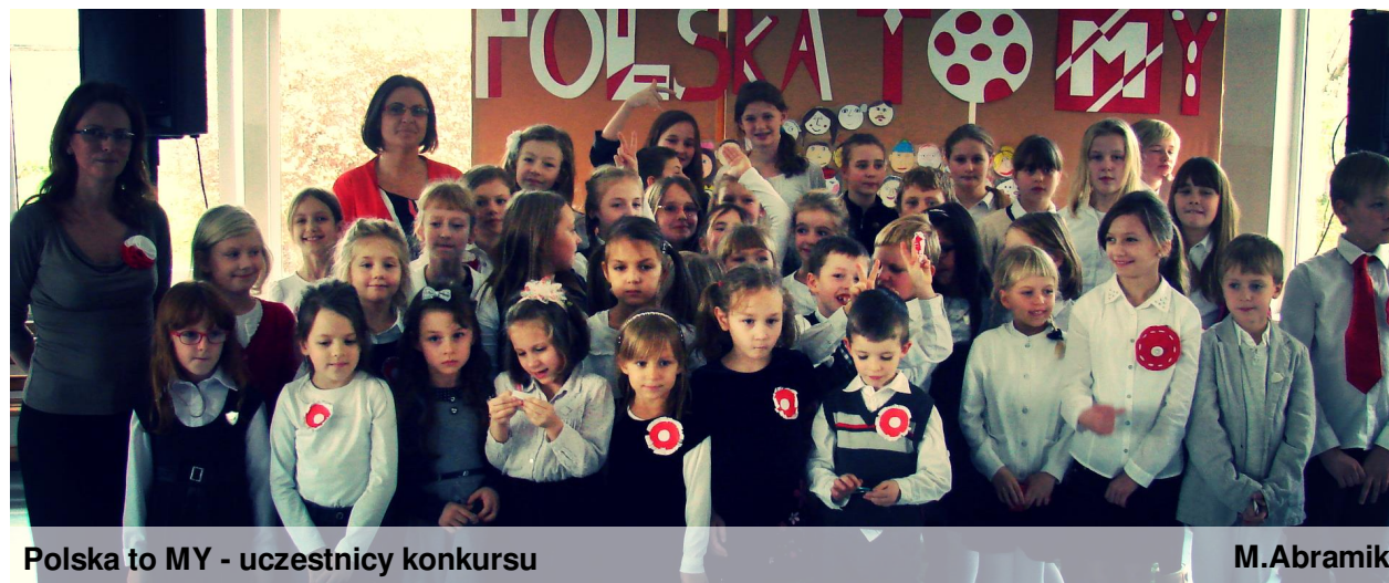
Polska to MY - uczestnicy konkursu

piosenki patriotyczne związane z tą uroczystością. Po krótkiej przerwie usłyszeliśmy poezję w wykonaniu uczniów klas starszych. Wszyscy byli wspaniale przygotowani. Gratulujemy odwagi i wspaniałych prezentacji.