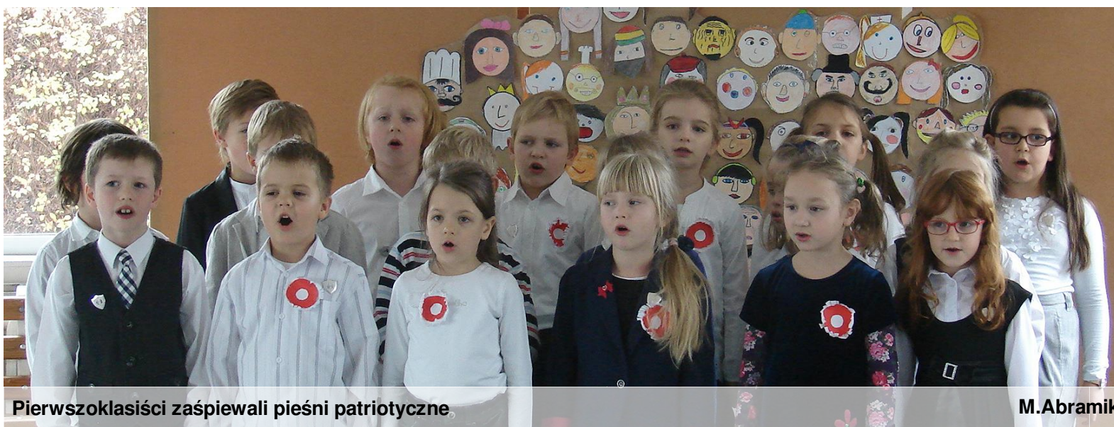
Pierwzoklasiści zaśpiewali pieśni patriotyczne.