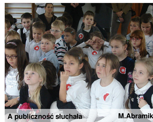
A publiczność słuchała