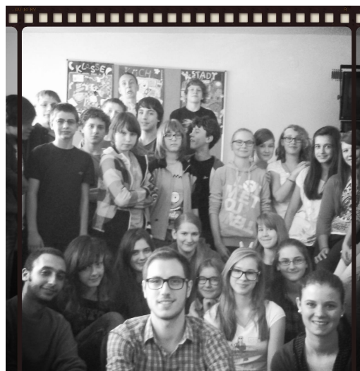
Studenci cudzoziemcy Gimnazjum nr.18