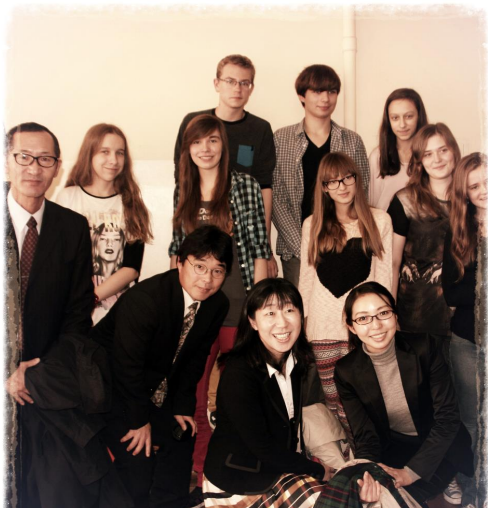
Nauczyciele z Japonii Gimnazjum nr.18

21.X naszą szkołę odwiedziła 6- osobowa grupa nauczycieli ze szkoły przy Ambasadzie Japońskiej. Ze względu na barierę językową w komunikowaniu się pomagała nam tłumaczka.