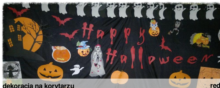
dekoracja na korytarzu