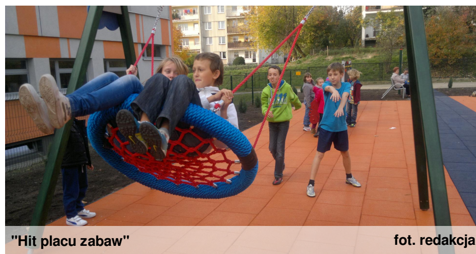
"Hit placu zabaw"