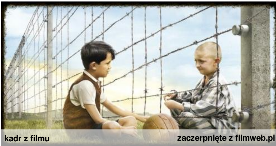
kadr z filmu