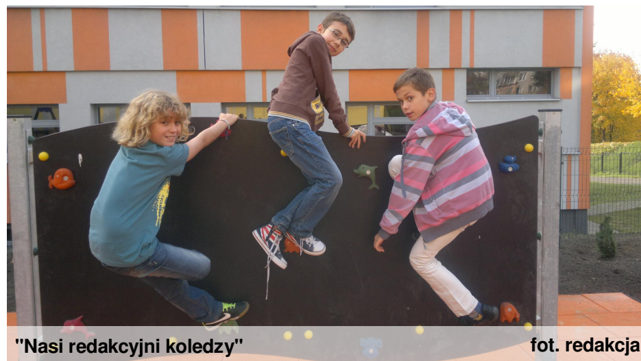
"Nasi redakcyjni koledzy"

Prosimy o szanowanie nowej inwestycji i życzymy miłej zabawy!