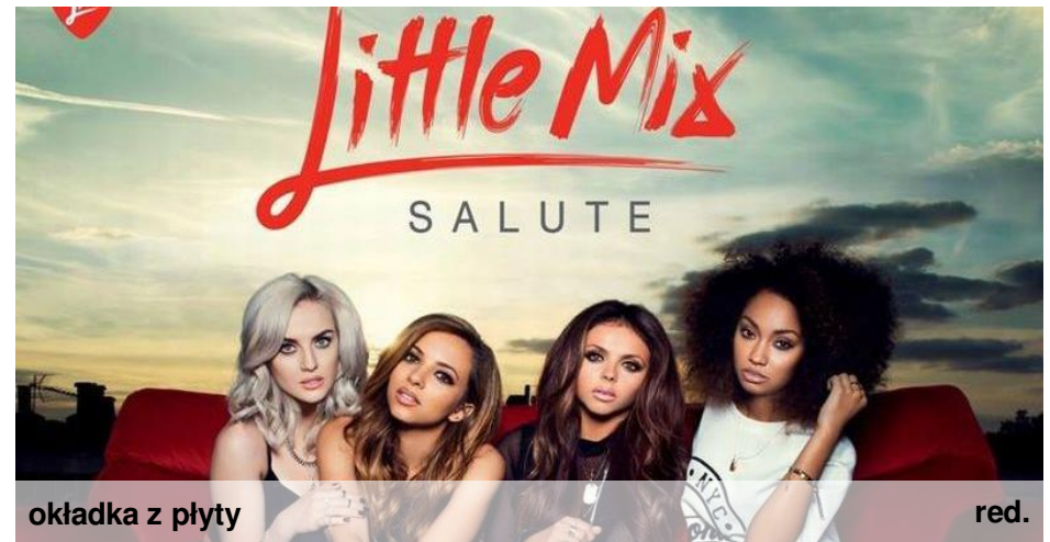
okładka z płyty