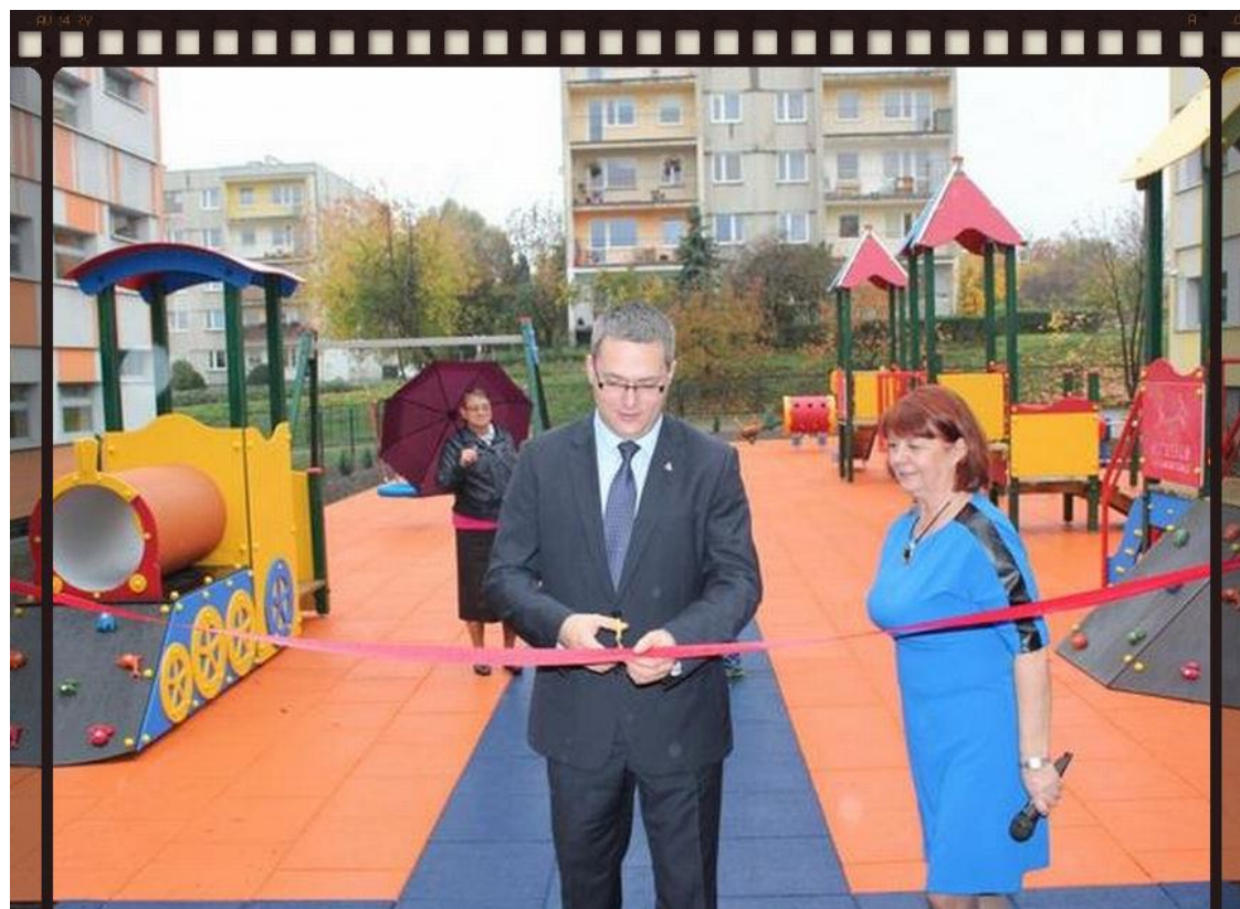
uroczyste otwarcie placu zabaw