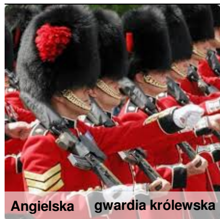
Angielska gwardia królewska

Oceniam ją pozytywnie, choć bywają momenty wątplenia, czy dobrze zrobiłam wybierając ten zawód.