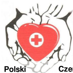
Polski Czerwony Krzyż

Polski Czerwony Krzyż to największa i najstarsza organizacja humanitarna w Polsce. Jesteśmy częścią Międzynarodowego