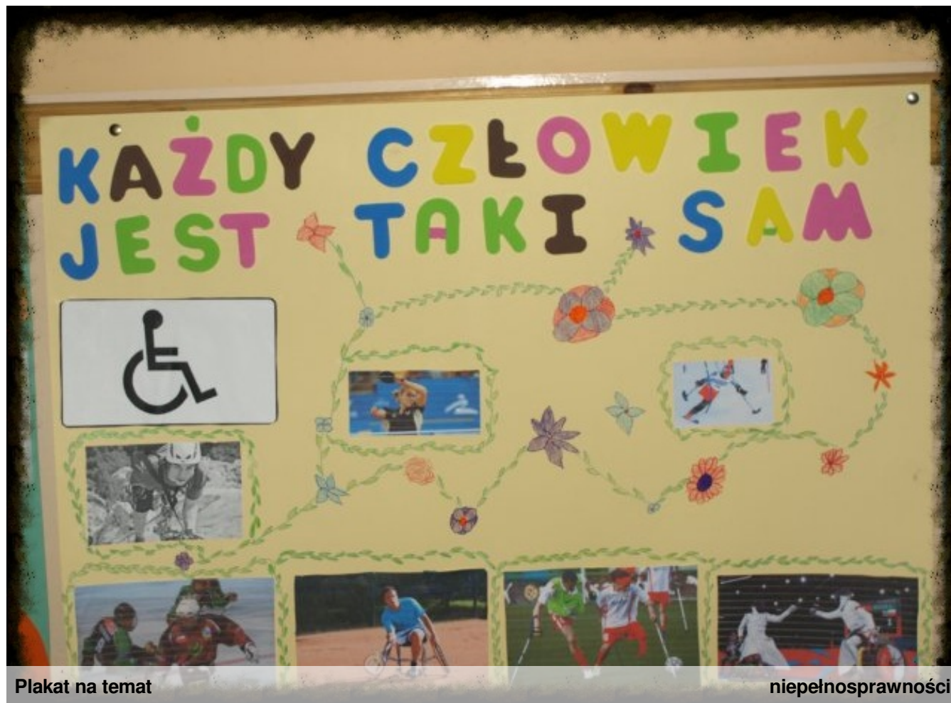
Plakat na temat