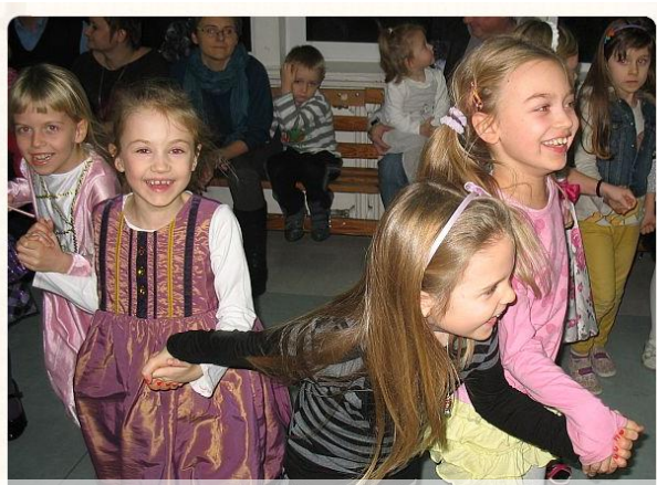
Świetna zabawa Red.

W tym roku zabawę andrzejkową zorganizowali rodzice uczniów klasy Ia. W czwartek 28 listopada w szkole pojawili się magowie, wróżbici, wróżki i cyganki. Każdy, kto tylko miał ochotę mógł więc poznać swoją przyszłość: a to zaglądając w karty, a to przelewając wosk przez potężny klucz, a to rozgryzając pyszne ciasteczko lub przekuwając serduszko... papierowe oczywiście. Zabawa była szalona i pyszna! Dziękujemy!