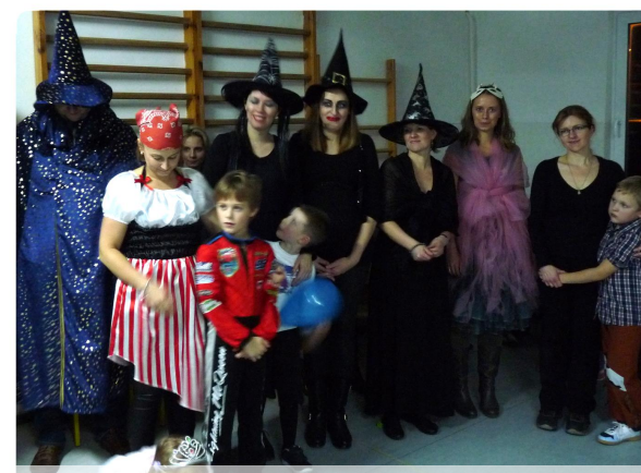
Wspaniali organizatorzy Red.

W tym roku zabawę andrzejkową zorganizowali rodzice uczniów klasy Ia. W czwartek 28 listopada w szkole pojawili się magowie, wróżbici, wróżki i cyganki. Każdy, kto tylko miał ochotę mógł więc poznać swoją przyszłość: a to zaglądając w karty, a to przelewając wosk przez potężny klucz, a to rozgryzając pyszne ciasteczko lub przekuwając serduszko... papierowe oczywiście. Zabawa była szalona i pyszna! Dziękujemy!