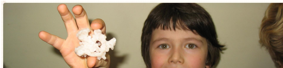
Trzymam przyszłość w swoich rękach Red.