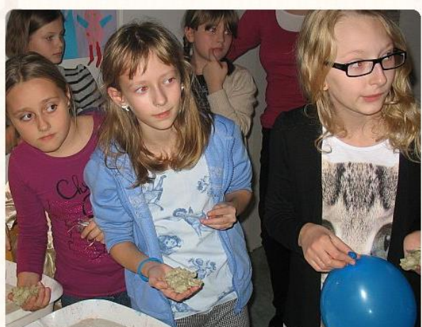
Każdy chce poznać swoją przyszłość... Red.