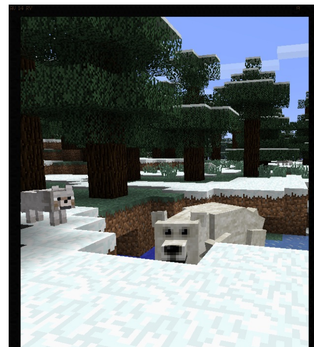
Motyw z gry