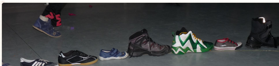
Wróżenie z butów Red.