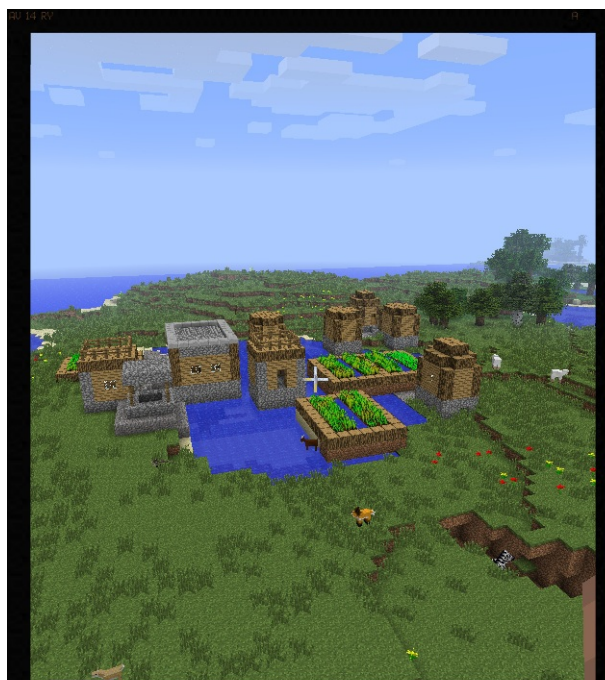
Motyw z gry