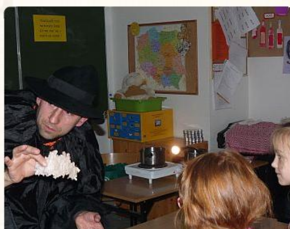
więc na cień zerkaj :) Red.