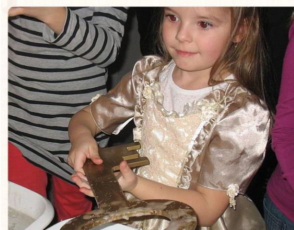
Klucz do ... Red.