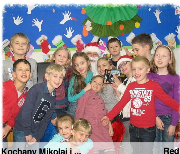
Kochany Mikołaj i ...