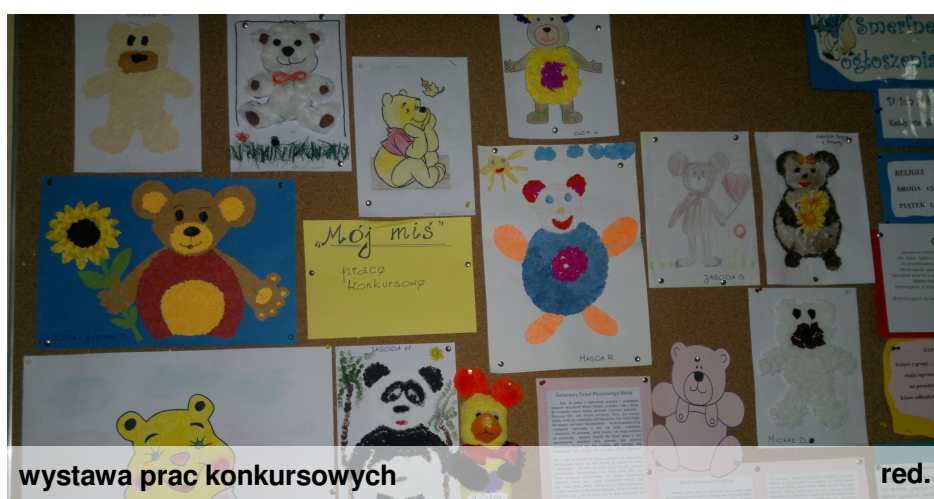
wystawa prac konkursowych