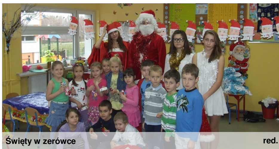
Święty w zerówce