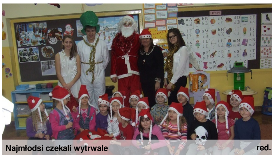
Najmłodszy czekali wytrwale