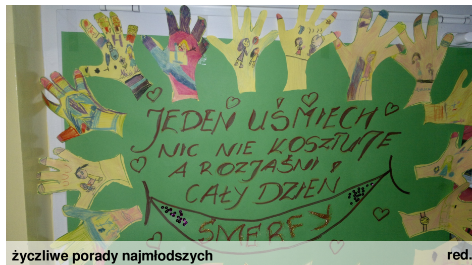
życzliwe porady najmłodszych