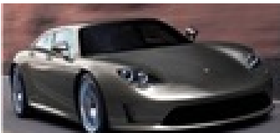
pomarzyć zawsze można