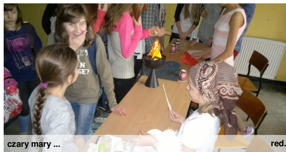
czary mary ...