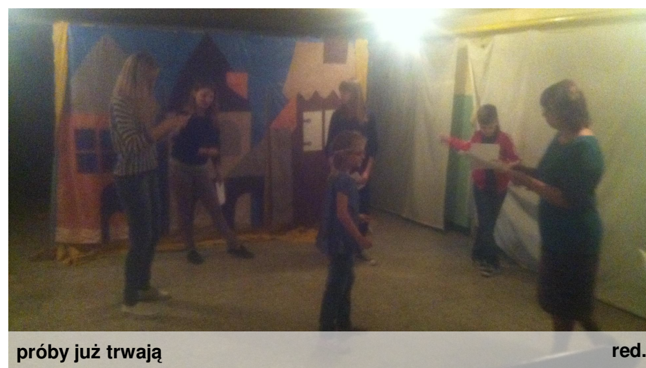
próby już trwają