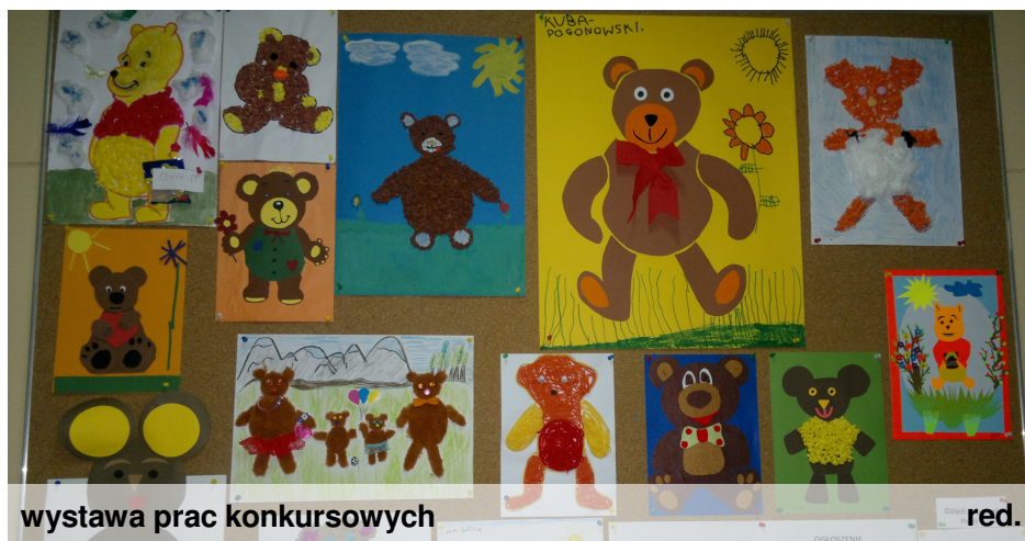
wystawa prac konkursowych