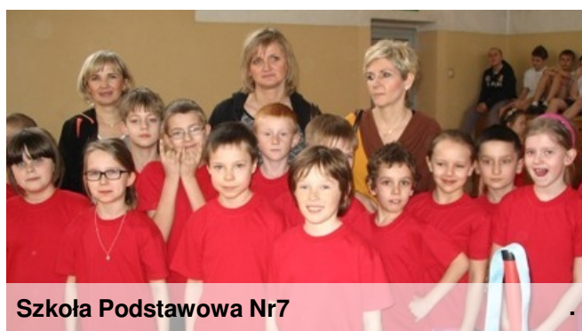
Szkoła Podstawowa Nr7