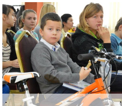
foto. wyróżnieni uczniowie

Natomiast wszyscy uczniowie, którzy przynieśli powyżej 25 kg makulatury otrzymali podziękowania i nagrody książkowe.