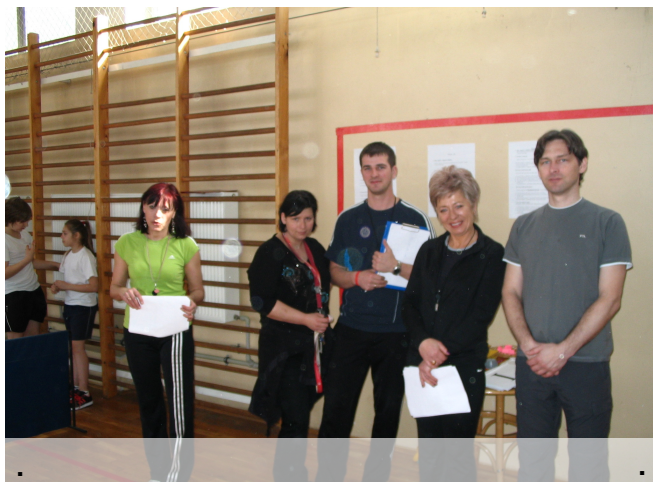
foto. nauczyciele wychowania fizycznego

Cieszymy się, iż możemy kontynuować to wspaniałe przedsięwzięcie, które sprzyja rozwojowi i popularyzacji zainteresowań uczniów, kształtuje właściwe postawy, aktywność fizyczną, posiada znaczące walory edukacyjne i wychowawcze a przede wszystkim przynosi naszym młodym sportowcom wiele satysfakcji i niezapomnianych przeżyć sportowych.