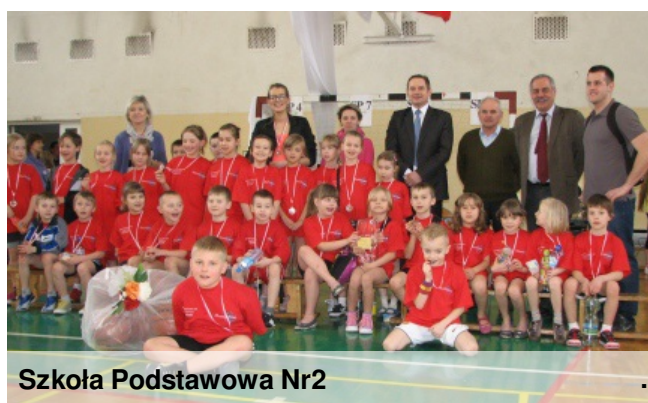
Szkoła Podstawowa Nr2