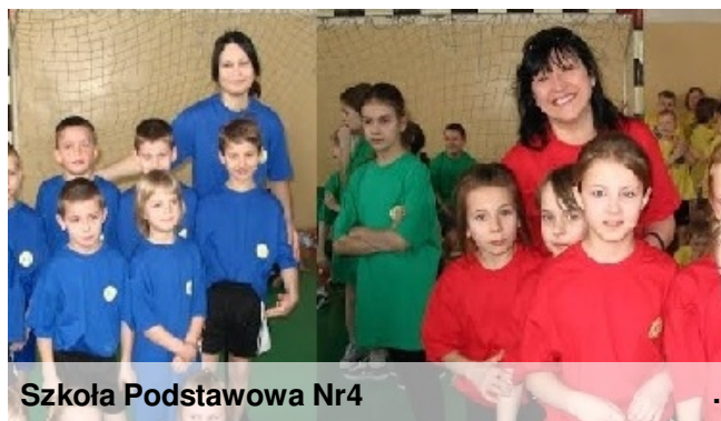
Szkoła Podstawowa Nr4