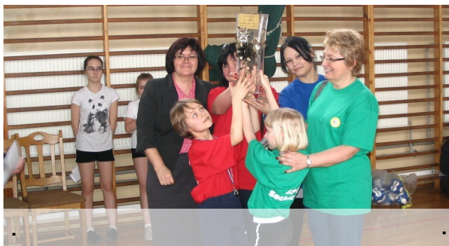
foto. drużyna z SP nr 4