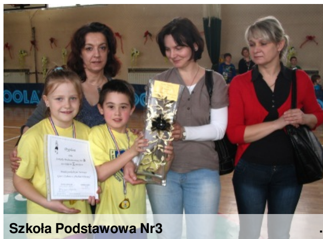
Szkoła Podstawowa Nr3