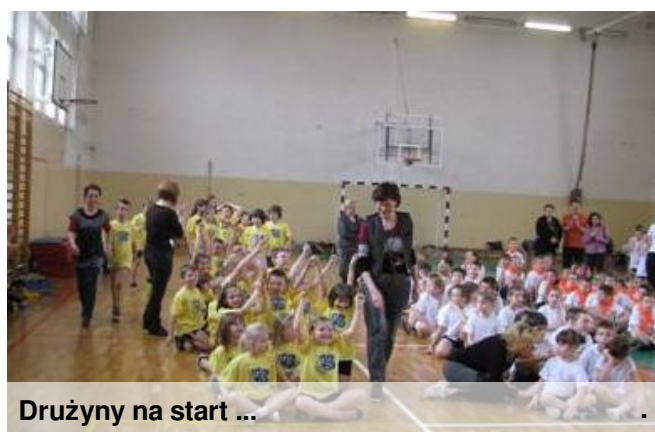
Drużyny na start ...