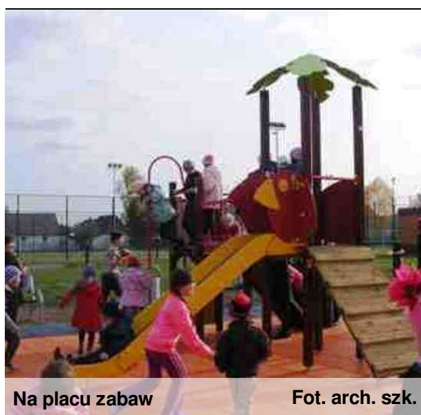
Na placu zabaw