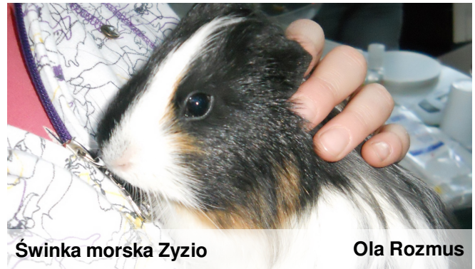
Świnka morska Zyzio