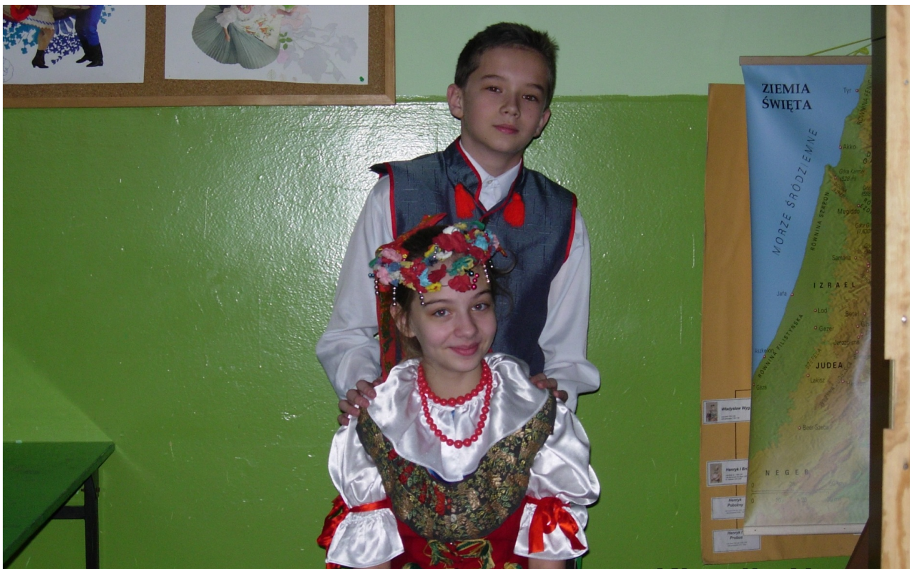
Ślaska baba i chop