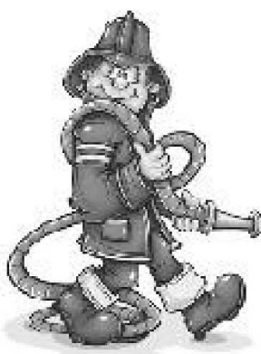
JEŚLI JESTEŚ SAM W DOMU:

UBIERAJ SIĘ NA "CEBULKĘ" Jeżdżąc na nartach - ZAWSZE ZAKŁADAJ KASK! NIGDY nie przyczepiaj sanek do samochodu! Rzucając śnieżkami, SPRAWDŹ czy nie są zbyt twarde, czy nie mają kawałków lodu lub kamieni. NIGDY nie zjeżdżaj na sankach lub nartach, jeśli zjazd prowadzi w stronę ulicy, stawu lub jeziora.