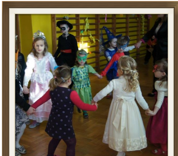
W rytmie muzyki

Karnawał to nieodłączny element dzieciństwa. Już od grudnia dzieci żyją myślą o już niedługo mającym nastąpić bale. Zabawy karnawałowe goszczą z powodzeniem już w przedszkolach, a im wyżej w stopniu edukacji poprzez szkołę podstawową, gimnazjum i kończąc na szkołach ponad gimnazjalnych, te zabawy są coraz bardziej wystawne i ciekawe. Zwłaszcza dla młodszych dzieci jest wspaniałą formą zabawy, ponieważ nie mają zbyt wiele okazji do tego rodzaju spędzenia czasu. Wiele konkursów i zajęć w czasie trwania tego balu to wspaniałe przeżycie dla naszych najmłodszych. Nieodłącznym elementem takich wydarzeń są odpowiednie stroje. Wokół tego istnieje prawdziwa otoczka tajemniczości i niecierpliwości. Dzieci starają się nie zdradzać przed swoimi rówieśnikami w co będą przebrane i w jaki sposób, a już na pewno nie zdradzają szczegółów swoich strojów karnawałowych.