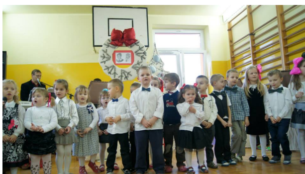
Najmłodszy babciom i dziadkom

Wszystkich zainteresowanych zapraszamy na nasz profil na Facebooku, gdzie znajdą Państwo więcej zdjęć i filmów z tej pięknej uroczystości.