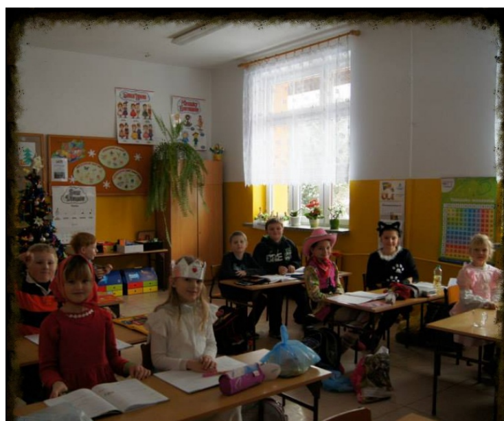
Przygotowania do balu