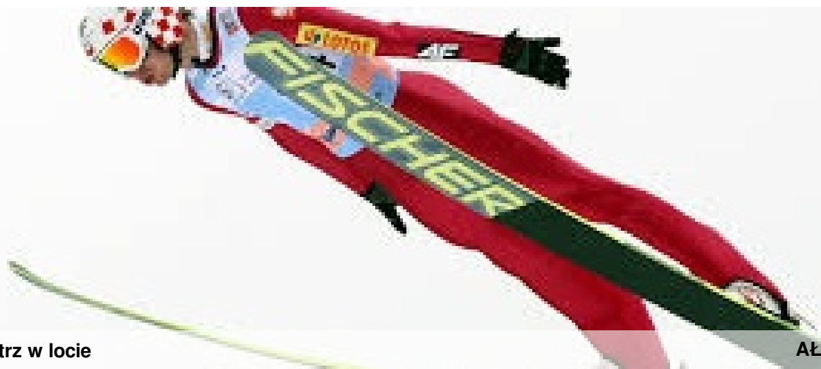
Mistrz w locie

10 lat później w 2005 roku znalazł się już na słynnej skoczni Pargelato we Włoszech. Tu jego starania przyniosły pierwsze sukcesy. Zakwalifikował się do pierwszej dziesiątki w Konkursie Pucharu Świata.