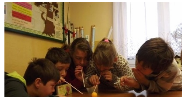
Kto ma silniejsze płuca?

Listopadowa akcja organizowana przez Samorząd Uczniowski przekonywała nas, że palenie to jedna z najgorszych rzeczy, którą możemy zafundować swojemu organizmowi.