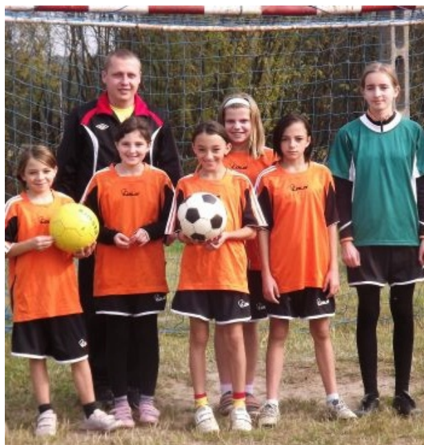
przed jesiennymi rozgrywkami

Wiemy o tym nie od dziś, dlatego nieustannie wcielamy tę zasadę w życie. Zarówno dziewczęta, jak i chłopcy biorą udział we wszystkich możliwych zawodach, a wysiłki naszego pana od WF-u nie idą na marne. W gminnych rankingach sportowych pniemy się w górę, a nasz duch walki rośnie w siłę. Z niecierpliwością czekamy na wiosnę, kiedy boisko szkolne ożyje na nowo.