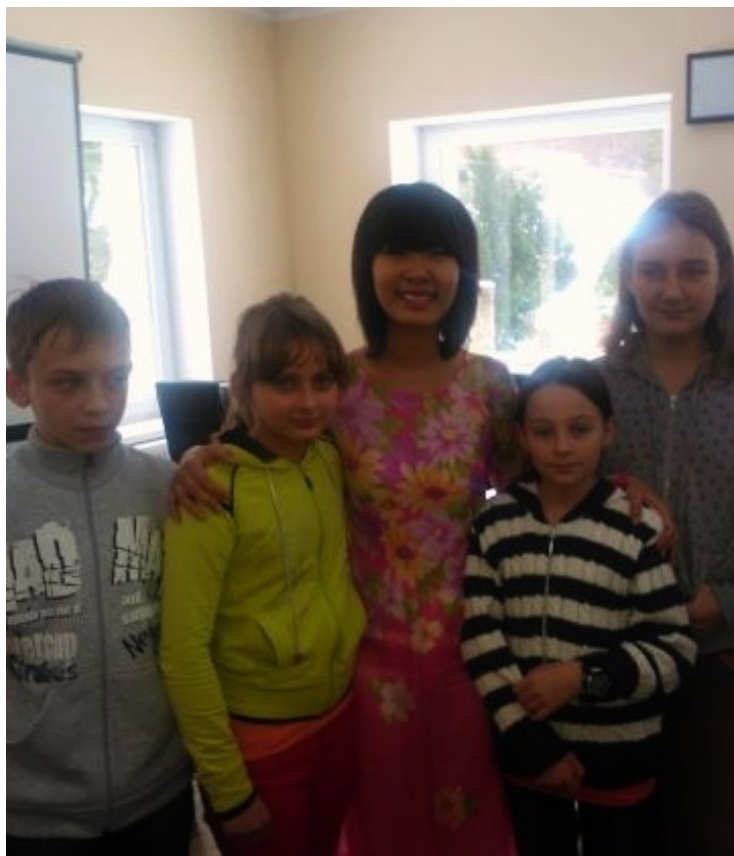
w objęciach mieszkanki Wietnamu

Mimo niesprzyjających warunków atmosferycznych udało im się dojechać do pięknej górskiej miejscowości Długopole Zdrój, gdzie czekali na nich wolontariusze z wielu krajów (Argentyna, Azerbejdżan, Estonia, Francja, Hiszpania, Indonezja, Kenia, Rumunia, Turcja, Wietnam). Wszyscy aktywnie brali udział w zajęciach prowadzonych w języku angielskim, które rozpoczynały się bladym świtem, a kończyły późnym wieczorem. Wolontariusze zadbali o to, aby uczestnicy w pełni wykorzystali czas spędzony w górskim ośrodku, a ciekawa i przystępna forma zajęć była odpowiednią motywacją do pogłębiania wiedzy.