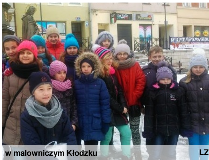
w malowniczym Kłodzku

Po powrocie podekscytowane i uśmiechnięte twarze naszych kolegów mówiły same za siebie. Każdy z nich bez wahania ponownie spakowałby walizkę i wyruszył w kilkunastogodzinną podróż do Długopola Zdroju. W doborowym towarzystwie czas płynie bardzo szybko i ani śniegi, ani mroźne wiatry nie psują dobrego nastroju. Do zobaczenia na następnym obozie!