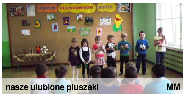
nasze ulubione pluszaki

Tradycją naszej szkoły są obchody dnia, który najmłodszy uczniowie naszej szkoły poświęcają swoim ulubionym pluszakom. W tym roku obchody były uświetnione przybyciem grupy animatorów, dzięki którym szkoła trzęsła się od wybuchów śmiechu naszych młodszych kolegów. Nawet szóstoklasiści mieli ochotę dołączyć!