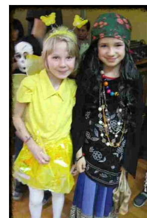
Cyganka i elf?