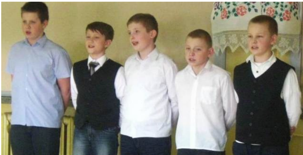
Chłopcy z kl. IV