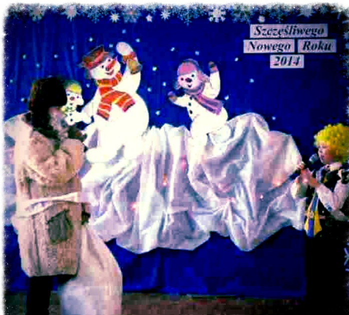
Stary Rok i Nowy Roczek

Choinka noworoczna jest już właściwie tradycją w naszej szkole. W tym roku odbyła się 25 stycznia 2014 r. Jak zwykle, rozpoczęły ją występy naszych szkolnych artystów. W radosny, karnawałowy nastrój zebraną publiczność wprowadził zespół wokalny „1/3” melodyjnymi piosenkami. Potem na scenie występowali uczniowie z klasy piątej oraz szkolne koło teatralne „Bajka”. Najbardziej rozśmieszył widownię skecz pt. „Święta” w wykonaniu szóstoklasistów. W występach choinkowych nie zabrakło też kolęd. Zaśpiewali je laureaci konkursu kolędniczego przygotowywani przez naszych katechetów. Atrakcją choinki noworocznej były odwiedziny Mikołaja, Śnieżynek i Elfów, którzy obdarowali prezentami przedszkolaków i dzieci klas I – III. Starsi uczniowie nie mogli doczekać się dyskoteki, bo dyskoteki nic nie zastąpi!!! Niestety, wszystko, co dobre kiedyś się kończy i tak właśnie było z dyskoteką. Jednak ból po jej zakończeniu zastąpiła radość z powodu rozpoczynających się ferii. Patrycja Mirończuk