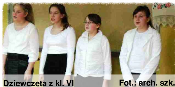
Dziewczęta z kl. VI