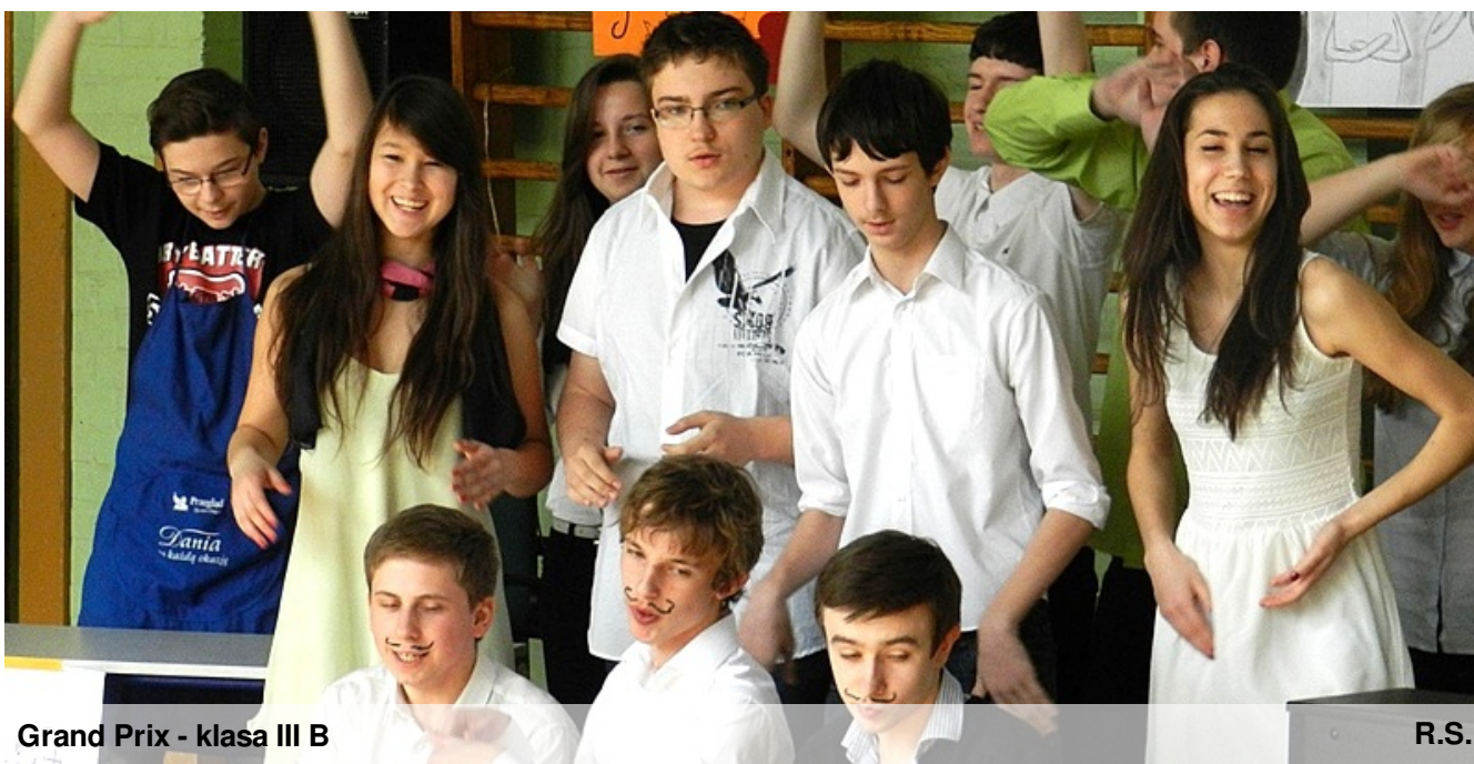
Grand Prix - klasa III B