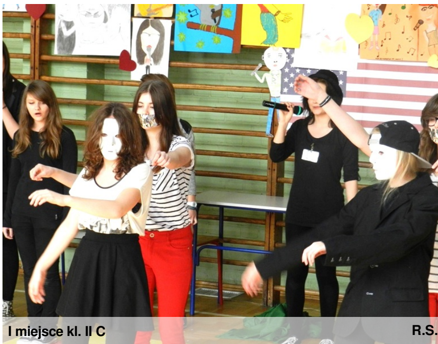
I miejsce kl. II C

21 marca odbył się trzeci i ostatni etap Bitwy na głosy. Poziom zmagania znacznie się podwyższył. W tym etapie usłyszeliśmy najwięcej francuskich piosenek.