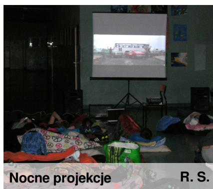
Nocne projekcje R. S.

14 marca już po raz ósmy w naszym gimnazjum odbyła się noc filmowa.