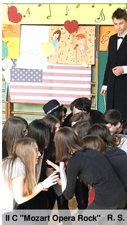
II C "Mozart Opera Rock" R. S.