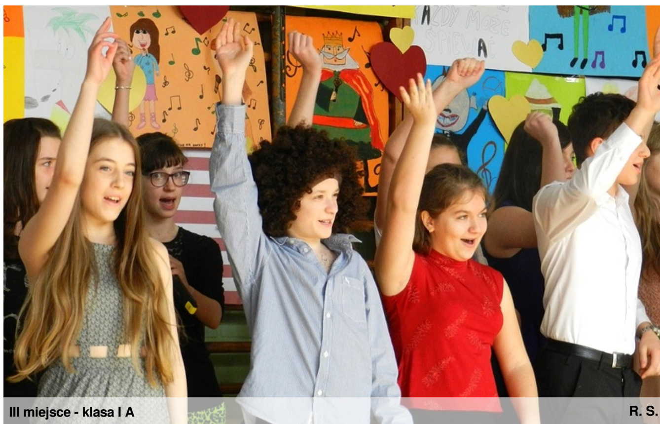
III miejsce - klasa I A