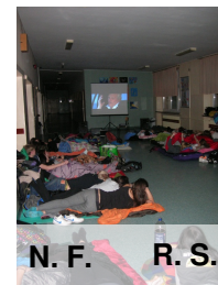
N. F. R. S.

adaptację „Romea i Julii” w reżyserii B. Lurhmana. Noc jak zwykle minęła za szybko dla kinomanów!