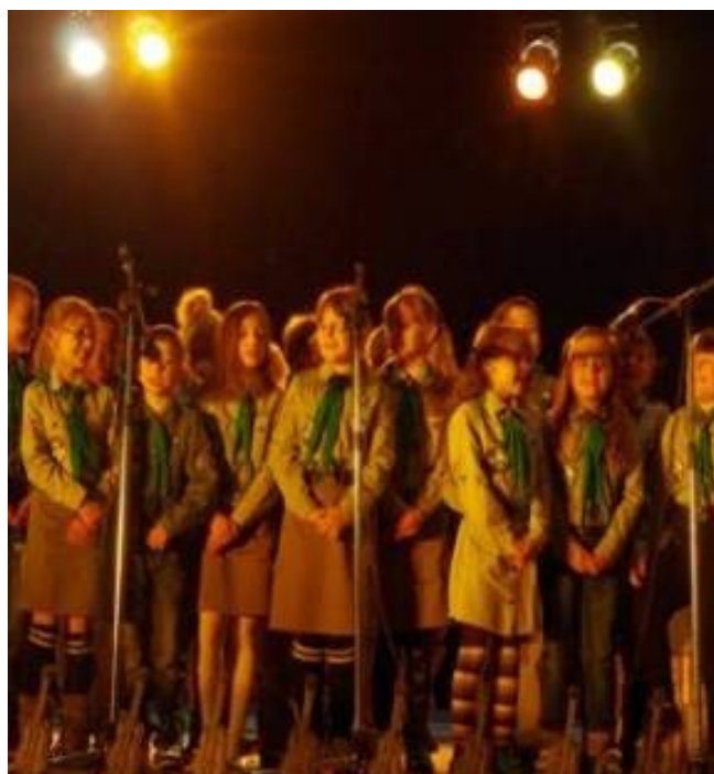
Przeгляд Piosenki Harcerskiej SPIRALA 2014

Zapraszamy do śpiewania harcerskich i turystycznych piosenek. A może zorganizujemy wspólnie szkolny festiwal piosenki turystycznej? Czekamy na odzew!