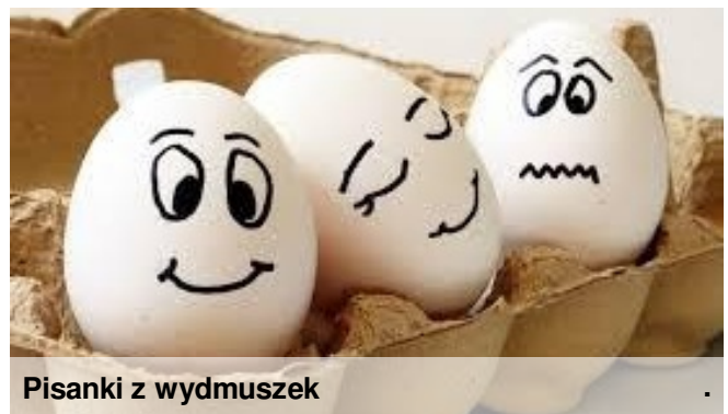
Pisanki z wydmuszek