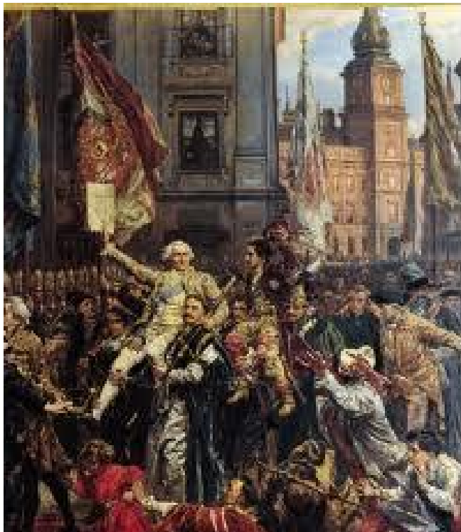
Konstytucja 3 Maja 1791 r.

W dzisiejszych czasach, święto straciło na znaczeniu ale warto tego dnia pamiętać o tych, którzy walczyli a czasem umierali walcząc o polepszenie warunków pracy.