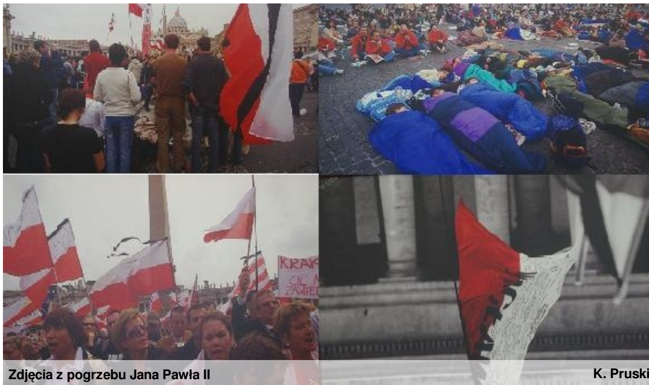
Zdjęcia z pogrzebu Jana Pawła II