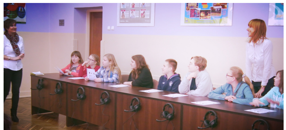
Szóstoklasiści w multimedialnej sali językowej