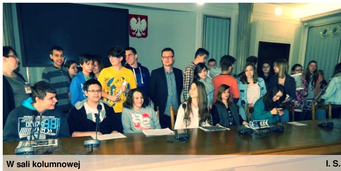
W sali kolumnowej