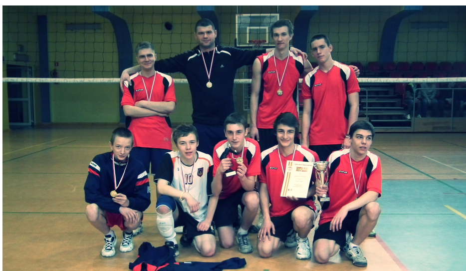
Nasza siatkarska drużyna chłopców