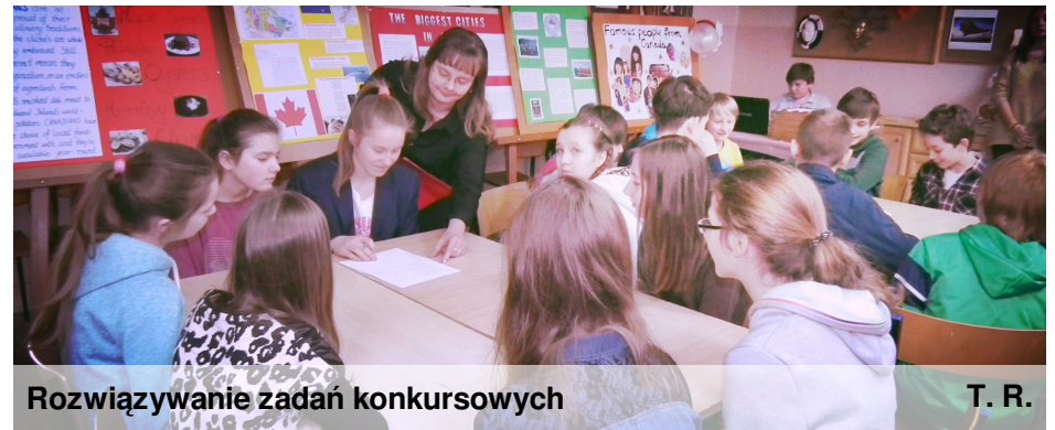
Rozwiązanie zadań konkursowych