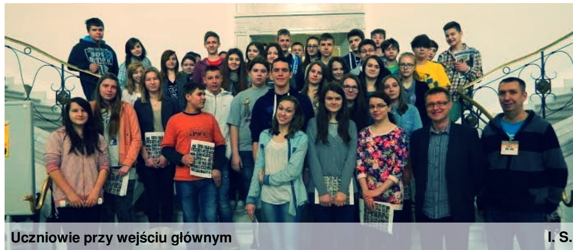
Uczniowie przy wejściu głównym

Po pożegnaniu z Panem Posłem wszyscy udali się na spacer po Warszawie.