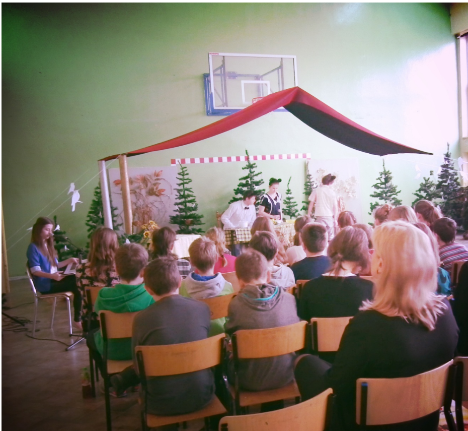
Przedstawienie "Goldie Locks"