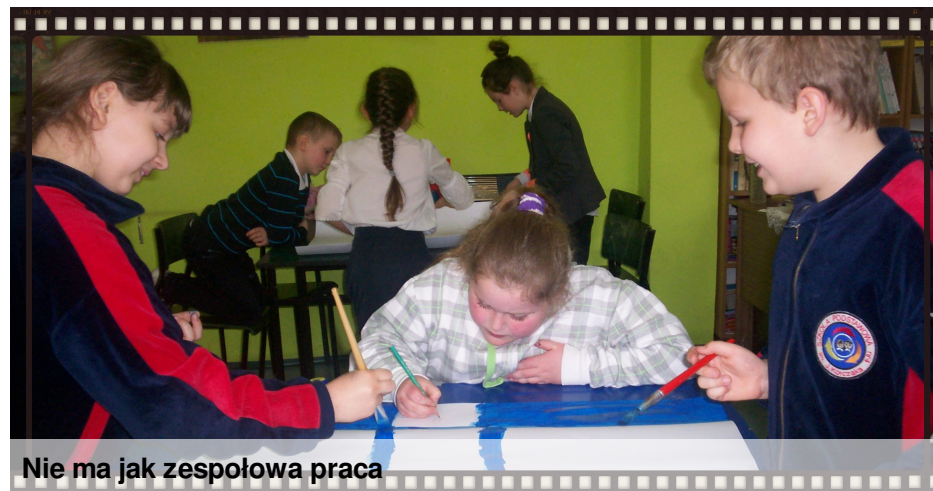
Nie ma jak zespołowa praca