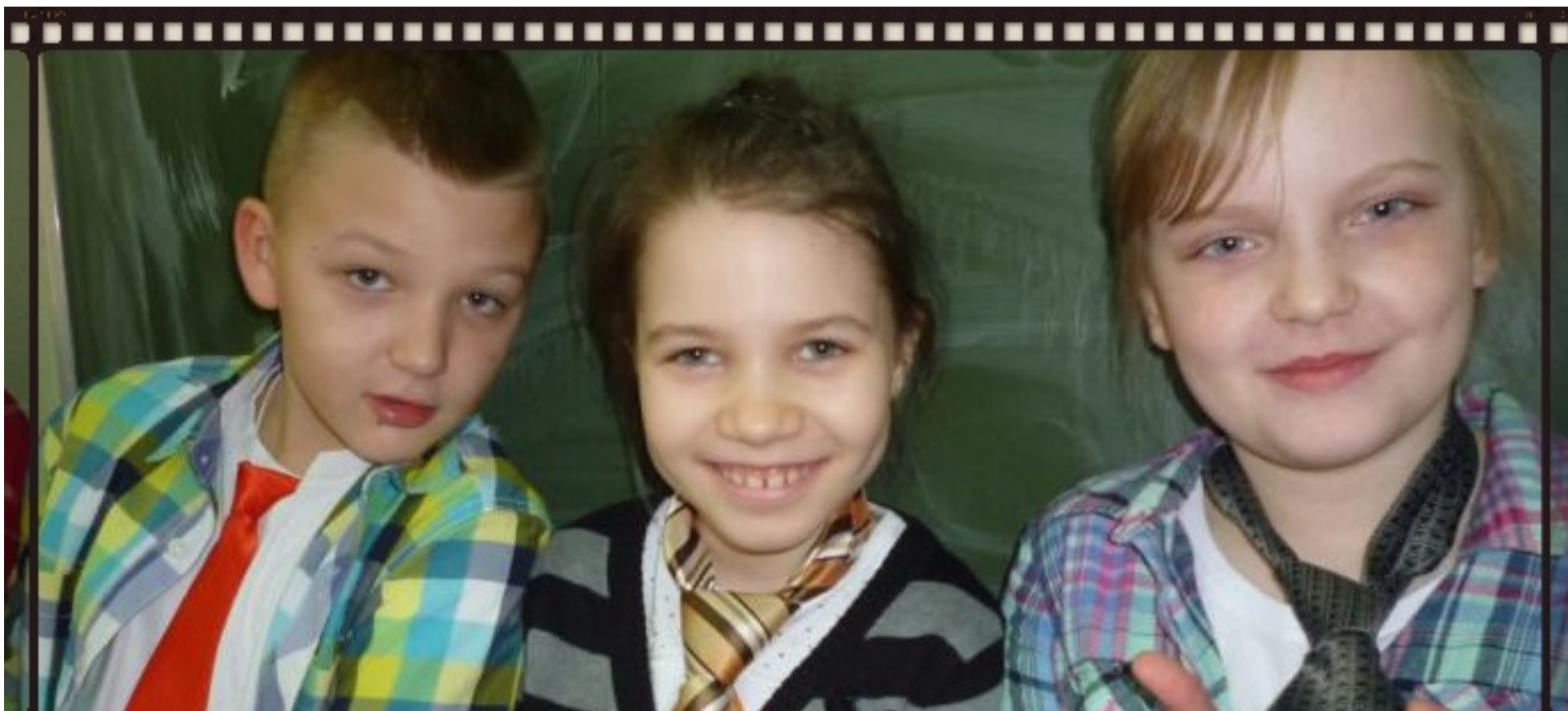
Dzień Krawata i Muszki