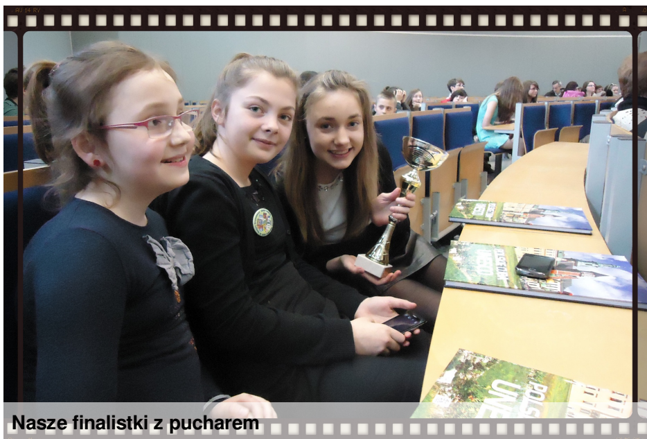
Nasze finalistki z pucharem