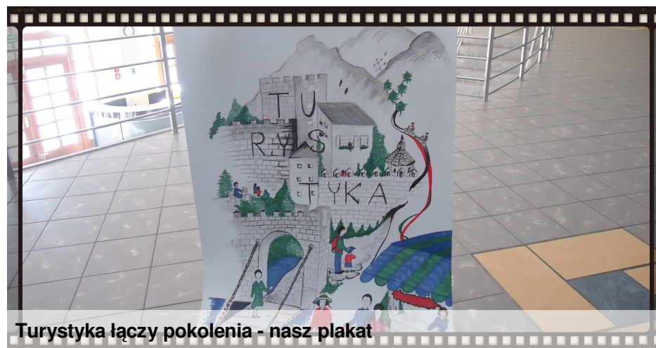
Turystyka łączy pokolenia - nasz plakat

W bibliotece szkolnej odbył się konkurs czytelniczy dla klas II z lektury Jana Grabowskiego „Buc, Bursztyn i goście”. Uczestnicy pracowali drużynowo, wybierali numery pytań, naradzali się, a potem udzielali odpowiedzi. Kolejna konkurencja polegała na namalowaniu farbami wybranej przez drużynę przygody bohaterów, potem trzeba było opowiedzieć tę przygodę. Drugoklasiści okazali się doskonale przygotowani, konkursowi towarzyszyły duże emocje, ponieważ był to ich pierwszy konkurs czytelniczy. I miejsce – klasa II a, II miejsce - IIb, III miejsce - IIc, IV miejsce - II d Redakcja