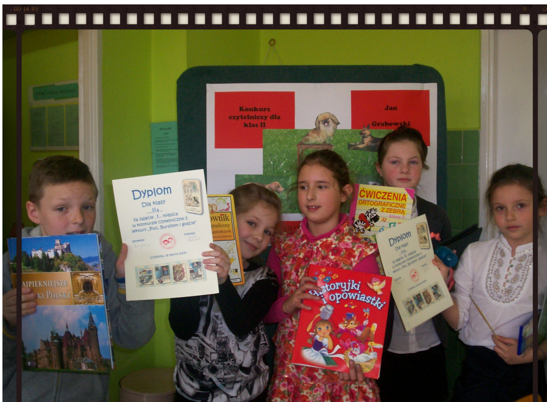
Laureaci konkursu "Puc, Bursztyn i goście"