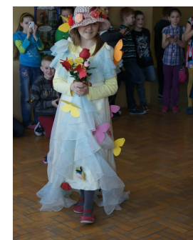
Pokaz mody M.C.

5.04 Dzień Leśnika i Drzewiarza 7.04 Dzień Służby Zdrowia 11.04 Dzień Radia 22.04 Międzynarodowy Dzień Ziemi