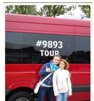
Auto "Kwiatka" Emi