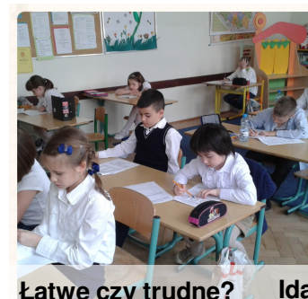
Łatwe czy trudne?