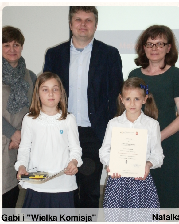
Gabi i "Wielka Komisja"