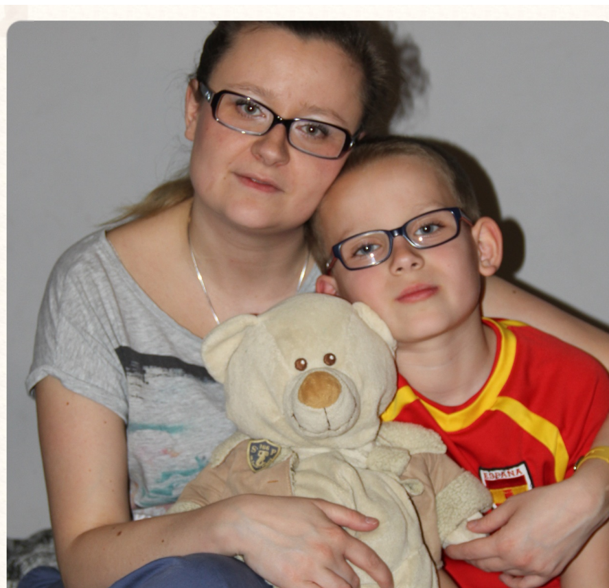
Uczniowie SP 166