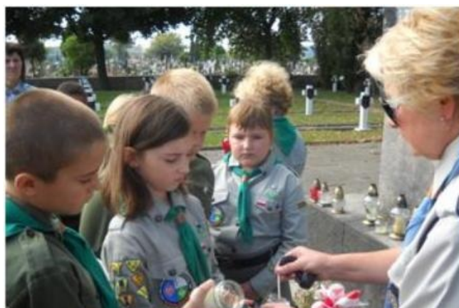
Zuchy kl. IIIb