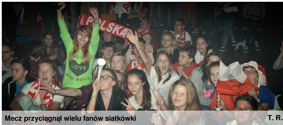
Mecz przyciągnął wielu fanów siatkówki