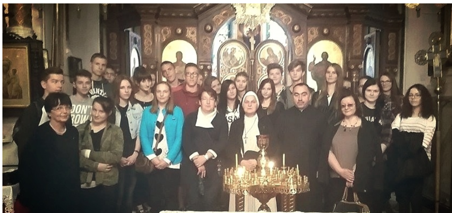
Klasy trzecie w cerkwi