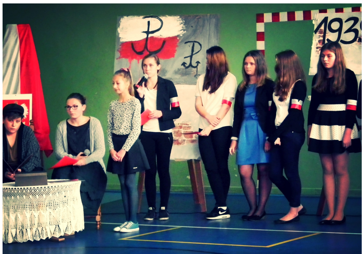
Uczniowie występujący w akademii