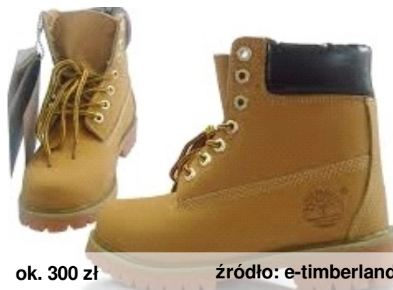
ok. 300 zł