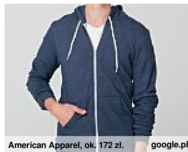
American Apparel, ok. 172 zł. google.pl