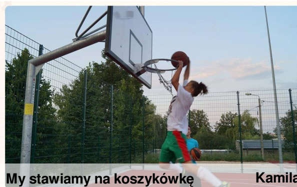
My stawiamy na koszykówkę