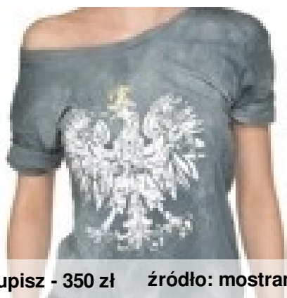
Robert Kupisz - 350 zł