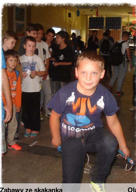
Zabawy ze skakanką