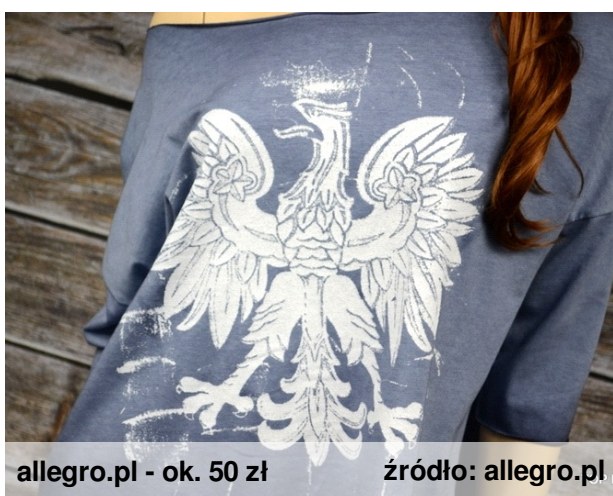
allegro.pl - ok. 50 zł