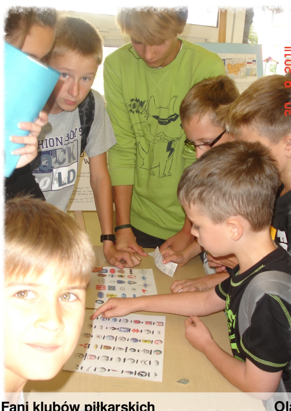
Fani klubów piłkarskich