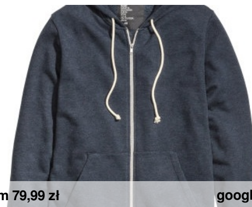
hm 79,99 zł google.pl