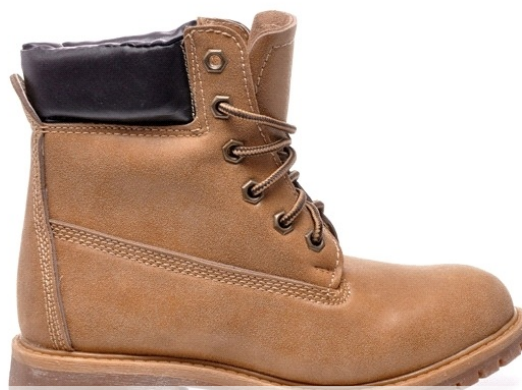
fleq.pl - ok. 50 zł