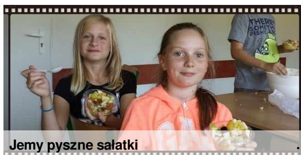
Jemy pyszne sałatki

Koty syjamskie pochodzą z Tajlandii, która kiedyś nazywana była syjmem, stąd nazwa rasy. Rasa ta ma ponad 500 lat. Koty syjamskie są tak wierne, jak psy. Rodzą się białe i gdy mają miesiąc posiadają