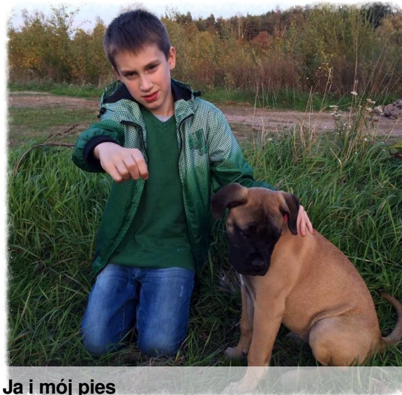
Ja i mój pies

W te wakacje spełniło się moje marzenie – dostałem psa. Nazwaliśmy go Łata. Wybraliśmy rasę psa bullmastiff. To rzadka rasa w Polsce. Dawniej psy te pomagały strażnikom leśnym, broniąc ich i terenu wokół. Psychika i cechy fizyczne czynią z bullmastiffa niezawodnego stróża i obrońcę.