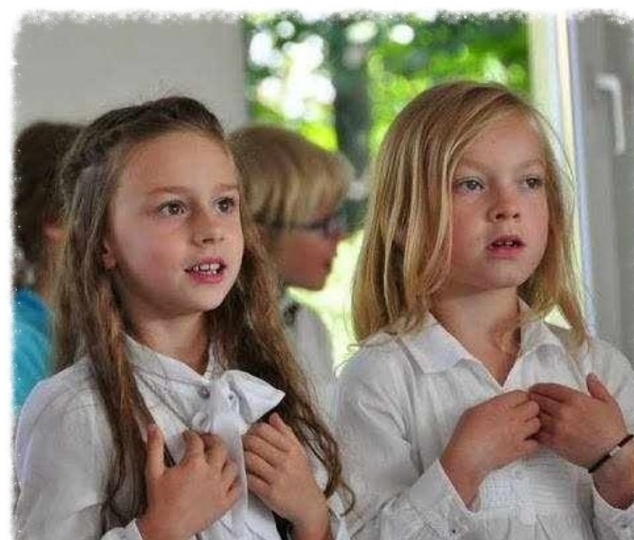
Skupienie na twarzach :-)