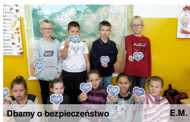
Dbamy o bezpieczeństwo

bezpieczeństwa na drodze. 23 października odbędzie się BEZPIECZNY FESTYN JESIENNY, podczas którego odbędzie się m.in. konkurs na Najpiękniejszą Odblaskową Panią Jesień, quiz wiedzy o bezpieczeństwie na drodze. Całość zakończy pyszny tort udekorowany znakami drogowymi. Relacja z tego wydarzenia w kolejnym numerze.