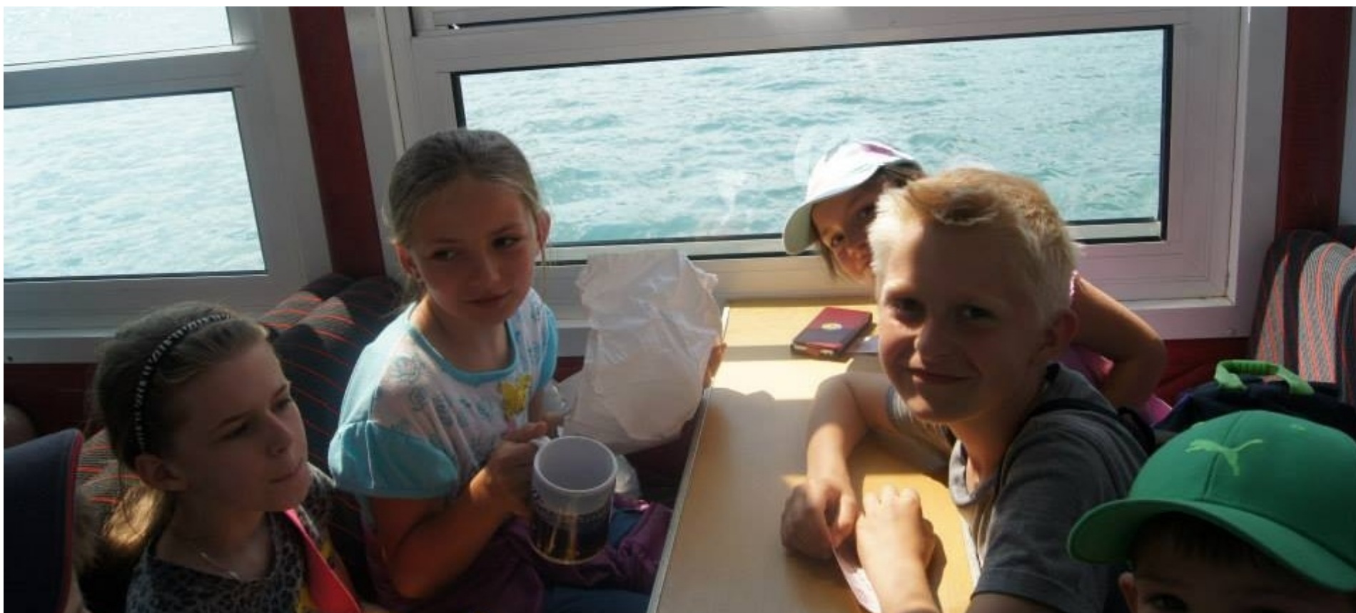
Rejs po Solinie