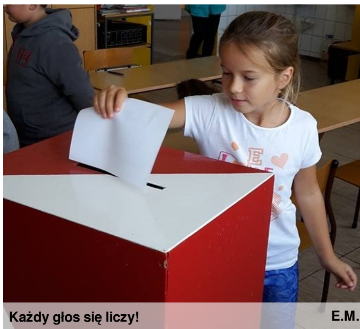
Każdy głos się liczy!